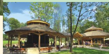
Tężnia Solankowa i Pijalnia Wód Mineralnych

Natomiast w 2020 roku zrewitalizowano część Parku Zdrojowego przy Śląskim Centrum Rehabilitacyjno-Uzdrowiskowym. Rozwinięto infrastrukturę uzdrowiskową a wraz z rewitalizacją parku, powstała kolejna tężnia solankowa