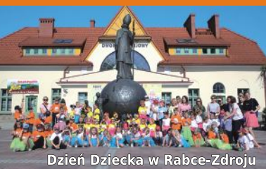
Dzień Dziecka w Rabce-Zdroju