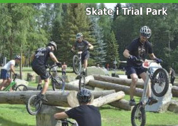
Skate i Trial Park