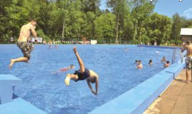
Basen, ul. Do Pocięsnej Wody