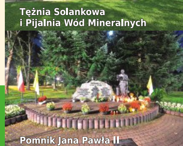
Pomnik Jana Pawła II