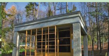
Tężnia przy ŚCRU