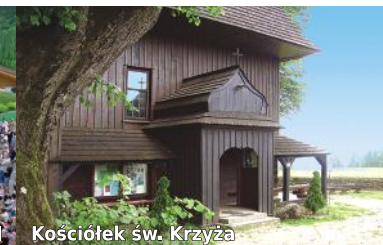
Kościółek św. Krzyża

Rabczański Amfiteatr to atrakcyjny obiekt zwany również muszlą koncertową posiada 850 miejsc siedzących, z czego 640 jest zadaszonych. Działające tu Centrum Kultury, Sportu i Promocji prowadzi wielokierunkową działalność w zakresie edukacji kulturalnej oraz wychowania przez sztukę, skierowaną do wszystkich grup wiekowych. Promuje twórczość amatorów i profesjonalistów w różnych dziedzinach. Przez cały rok odbywają się zajęcia muzyczne, taneczne, teatralne, plastyczne, literackie i inne (kursy, warsztaty, lekcje indywidualne). Realizowane są ciekawe projekty m.in.: koncerty, imprezy plenerowe, spotkania cykliczne, konkursy, happeningi, projekty edukacyjne dla osób uzdolnionych artystycznie oraz wystawy.