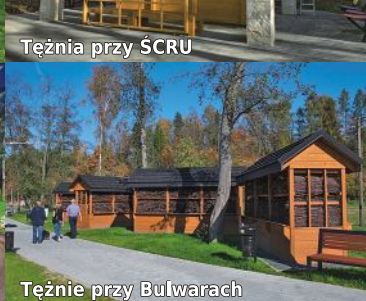
Tężnie przy Bulwarach

W centrum Parku znajduje się pomnik Jana Pawła II. Usytuowany jest na trasie tzw. Szlaku Papieskiego wiodącego przez Gorce i Beskid Wyspowy. Szlak prowadzi przez ulubione miejsca, którymi wędrował Karol Wojtyła, najpierw jako ksiądz, potem biskup i kardynał, oraz które odwiedzał jako papież.