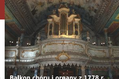
Balkon chóru i organy z 1778 r.

Muzeum im. Wł. Orkana znajduje się w modrzewiowym, zabytkowym kościełku św. Marii Magdaleny, wzniesionym w latach 1600-1606. Kościółek jest jednym z najcenniejszych zabytków drewnianej, góralskiej architektury sakralnej. Otoczony jest kamiennym murem, kryty gontem. Ekspozycje muzealne ukazują dawny świat oraz dorobek materialny i duchowy górali zamieszkujących Beskidy. Większość zgromadzonych tu