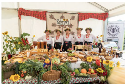
▲ DOŻYNKI GMINNE