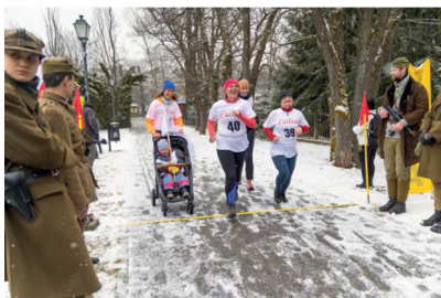
▲ XI BIEG PAMIĘCI ŻOŁNIERZY WYKLĘTYCH – TROPEM WILCZYM