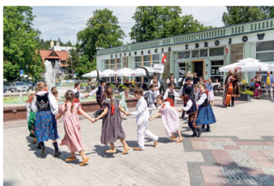
▲ 46. KARPACKI FESTIWAL DZIECIĘCYCH ZESPOŁÓW REGIONALNYCH