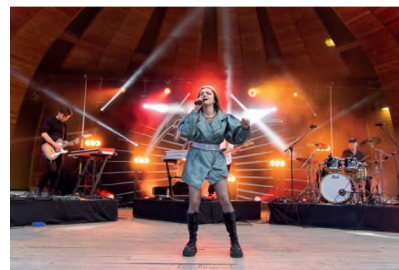
▲ DZIEŃ DZIECKA - KONCERT LANBERRY