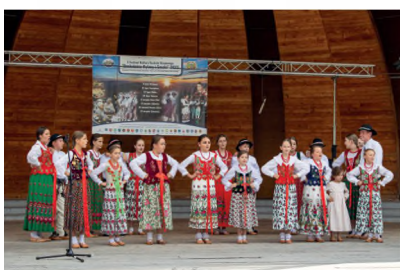
▲ FESTIWAL BESKIDZKIE RYTMY I SMAKI