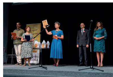
▲ RABKA FESTIVAL