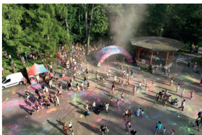
▲ EKSPLOZJA KOLORÓW