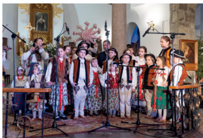
▲ TRADYCYJNE KOLEDOWANIE ROBCUSI I ROBCAŃ