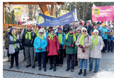
▲ X OGÓLNOPOLSKA ZIMOWA SENIORIADA