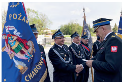
▲ DZIEŃ STRAŻAKA