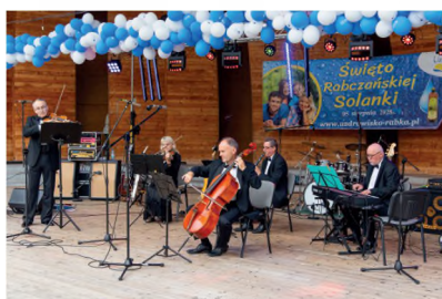
▲ ŚWIĘTO SOLANKI