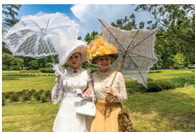
▲ DAWNEJ RABKI CZAR