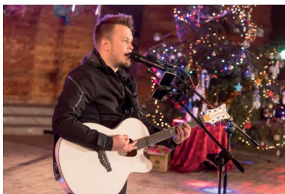
▲ POWITANIE NOWEGO ROKU