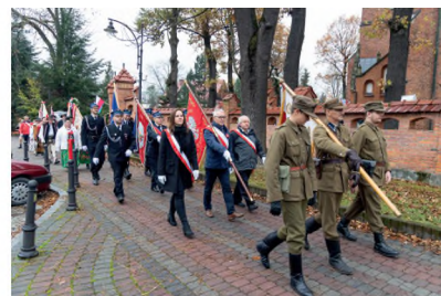
▲ DZIEŃ NIEPODLEGŁOŚCI