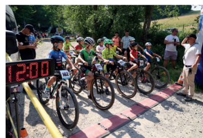
▲ PUCHAR SZLAKU SOLNEGO