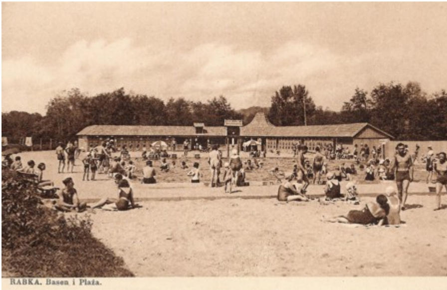
RABKA. Basen i Plaża.

zakład przyrodolecznicy. Wyzwolenie przyniosły Rabce wojska radzieckie w dniu 28 stycznia 1945 roku.