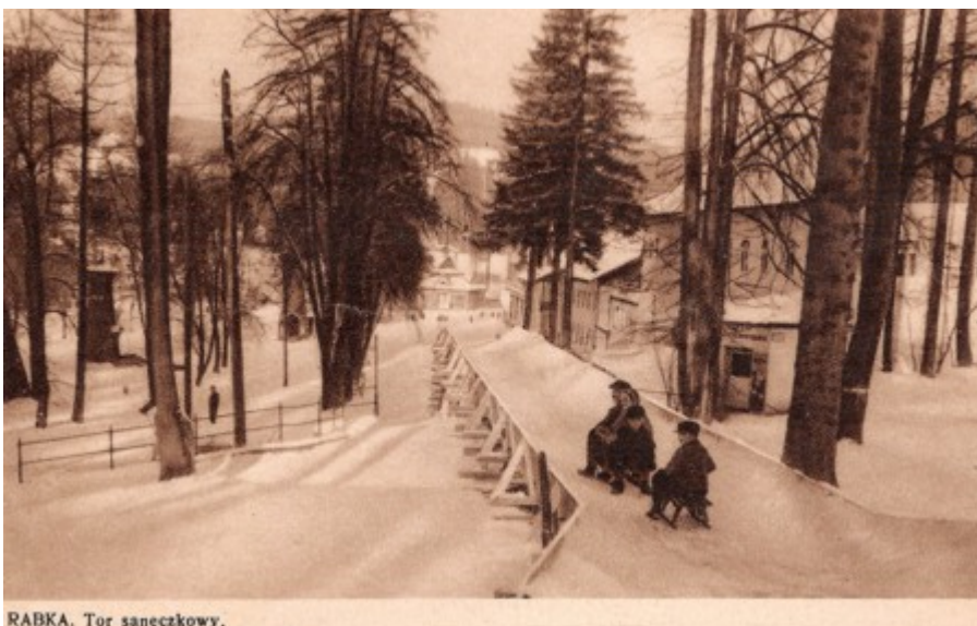
RABKA. Tor saneczkowy.