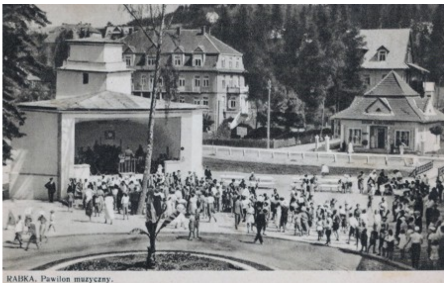
RABKA. Pawilon muzyczny.

10 czerwca 1947 roku zostaje otwarte pierwsze sanatorium obserwacyjne Zespołu w willi „Wiosna”, a 20 czerwca kolejne w budynku Oficerskiego Domu Wypoczynkowego. W miejsce Sanatorium Czerwonego Krzyża powstał Dziecięcy Ośrodek Sanatoryjno-Prewencyjny im. Wincentego Pstrowskiego na ok. 800 łóżek dla dzieci śląskich górników /dzisiaj Ośrodek Rehabilitacyjny im. dr. Adama Szabestego/. Istniejące Dziecięce Sanatorium Rodziny Kolejowej /dzisiaj Dziecięcy Szpital Uzdrawiskowo-Rehabilitacyjny Rodziny Kolejowej im. A. Piłsudskiej /oddano również na cele walki z gruźlicą.