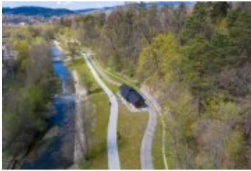
• 2020_04_29_Rabczańskie bulwary z lotu ptaka i nocą