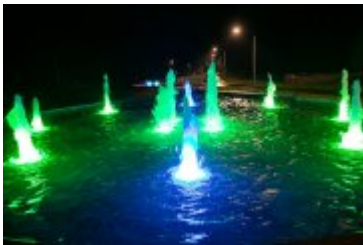
• 2020-10-07-Rabczańskie bulwary nocą