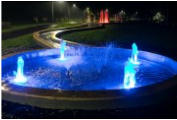
• 2020-10-07-Rabczańskie bulwary nocą