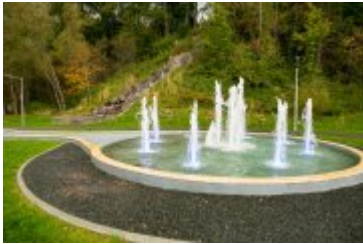
• 2020-10-07-Fontanny nad bulwarami uruchomione