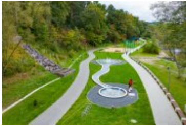
• 2020-10-07-Fontanny nad bulwarami uruchomione