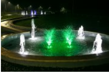
• 2020-10-07-Rabczańskie bulwary nocą