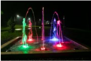
• 2020-10-07-Rabczańskie bulwary nocą