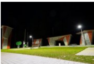
• 2020_04_29_Rabczańskie bulwary z lotu ptaka i nocą