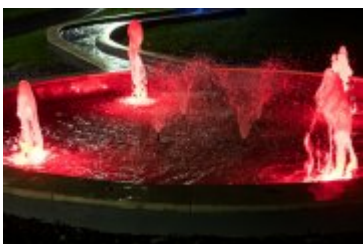
• 2020-10-07-Rabczańskie bulwary nocą