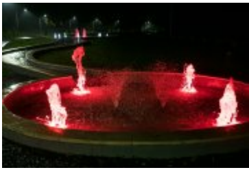
• 2020-10-07-Rabczańskie bulwary nocą