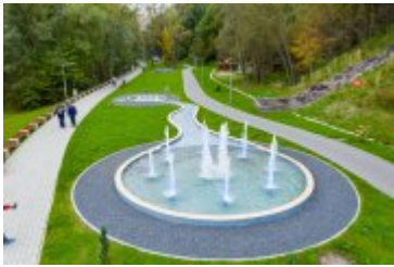
• 2020-10-07-Fontanny nad bulwarami uruchomione