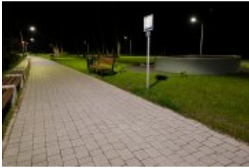
• 2020_04_29_Rabczańskie bulwary z lotu ptaka i nocą