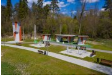
• 2020_04_29_Rabczańskie bulwary z lotu ptaka i nocą