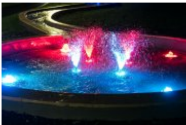
• 2020-10-07-Rabczańskie bulwary nocą