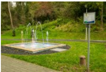
• 2020-10-07-Fontanny nad bulwarami uruchomione