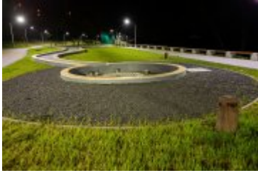
• 2020_04_29_Rabczańskie bulwary z lotu ptaka i nocą