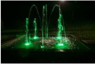
• 2020-10-07-Rabczańskie bulwary nocą