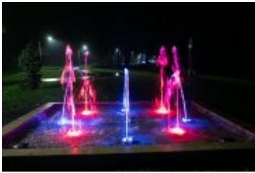
• 2020-10-07-Rabczańskie bulwary nocą