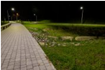
• 2020_04_29_Rabczańskie bulwary z lotu ptaka i nocą