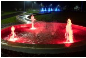
• 2020-10-07-Rabczańskie bulwary nocą