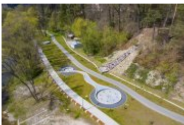
• 2020_04_29_Rabczańskie bulwary z lotu ptaka i nocą