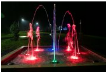
• 2020-10-07-Rabczańskie bulwary nocą