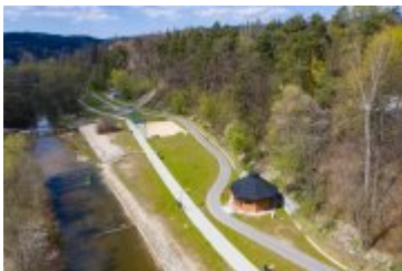
• 2020_04_29_Rabczańskie bulwary z lotu ptaka i nocą