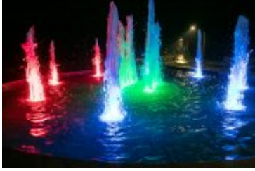
• 2020-10-07-Rabczańskie bulwary nocą