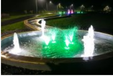
• 2020-10-07-Rabczańskie bulwary nocą