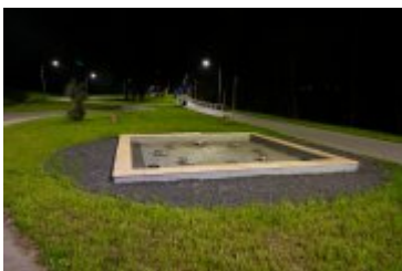
• 2020_04_29_Rabczańskie bulwary z lotu ptaka i nocą