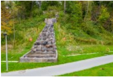
• 2020-10-07-Fontanny nad bulwarami uruchomione