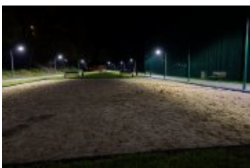
• 2020_04_29_Rabczańskie bulwary z lotu ptaka i nocą