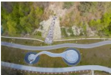
• 2020_04_29_Rabczańskie bulwary z lotu ptaka i nocą