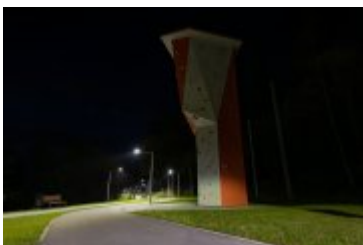
• 2020_04_29_Rabczańskie bulwary z lotu ptaka i nocą