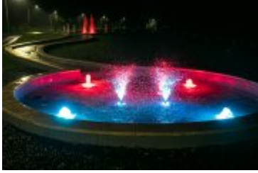
• 2020-10-07-Rabczańskie bulwary nocą