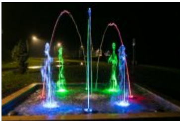
• 2020-10-07-Rabczańskie bulwary nocą