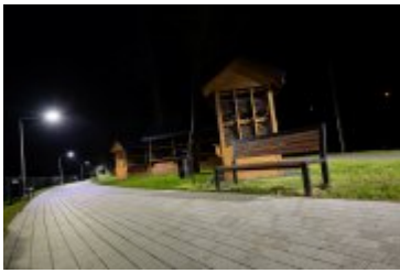
• 2020_04_29_Rabczańskie bulwary z lotu ptaka i nocą