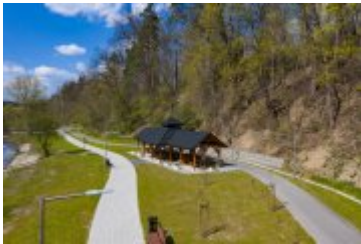
• 2020_04_29_Rabczańskie bulwary z lotu ptaka i nocą