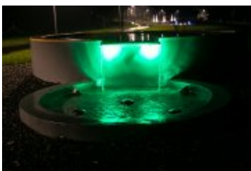
• 2020-10-07-Rabczańskie bulwary nocą