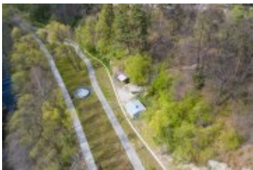
• 2020_04_29_Rabczańskie bulwary z lotu ptaka i nocą