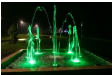
• 2020-10-07-Rabczańskie bulwary nocą