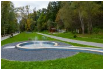
• 2020-10-07-Fontanny nad bulwarami uruchomione