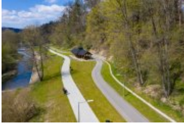
• 2020_04_29_Rabczańskie bulwary z lotu ptaka i nocą