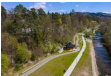
• 2020_04_29_Rabczańskie bulwary z lotu ptaka i nocą