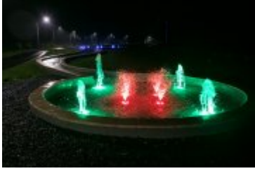
• 2020-10-07-Rabczańskie bulwary nocą