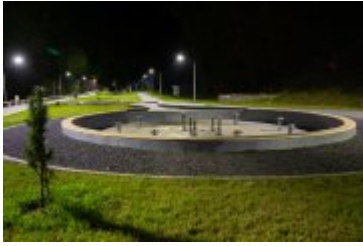
• 2020_04_29_Rabczańskie bulwary z lotu ptaka i nocą