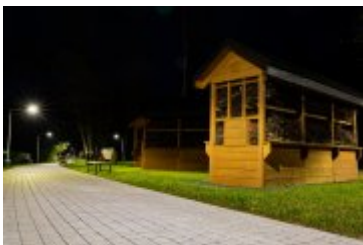
• 2020_04_29_Rabczańskie bulwary z lotu ptaka i nocą