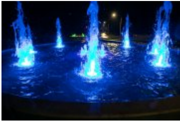
• 2020-10-07-Rabczańskie bulwary nocą