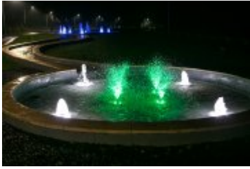
• 2020-10-07-Rabczańskie bulwary nocą