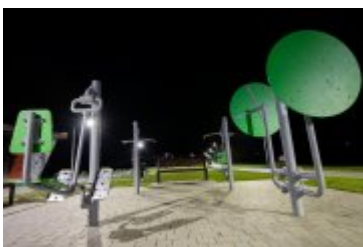
• 2020_04_29_Rabczańskie bulwary z lotu ptaka i nocą