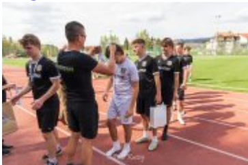
• 2025-04-21- Charytatywny Turniej Piłkarski "Gramy Dla Pogorzalców"