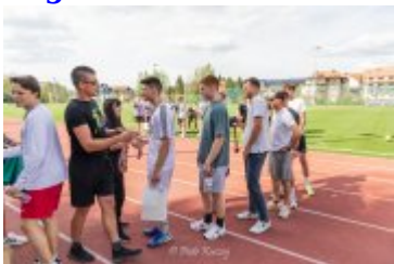
• 2025-04-21- Charytatywny Turniej Piłkarski "Gramy Dla Pogorzalców"