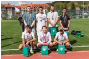
• 2025-04-21- Charytatywny Turniej Piłkarski "Gramy Dla Pogorzalców"