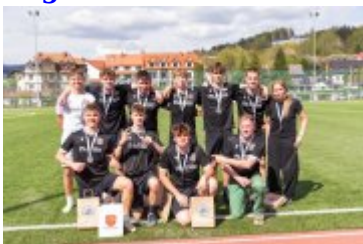
• 2025-04-21- Charytatywny Turniej Piłkarski "Gramy Dla Pogorzalców"