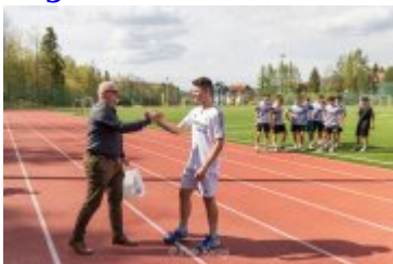
• 2025-04-21- Charytatywny Turniej Piłkarski "Gramy Dla Pogorzalców"