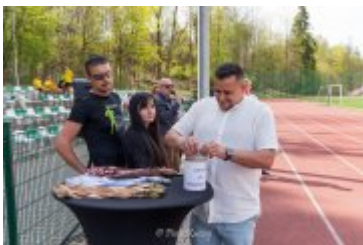
• 2025-04-21- Charytatywny Turniej Piłkarski "Gramy Dla Pogorzalców"