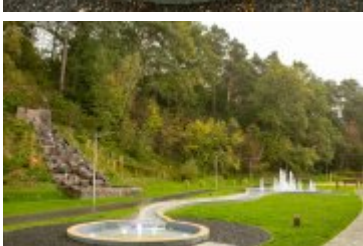
• 2020-10-07-Fontanny nad bulwarami uruchomione