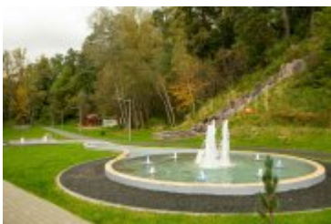
• 2020-10-07-Fontanny nad bulwarami uruchomione