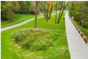
• 2020-10-07-Fontanny nad bulwarami uruchomione