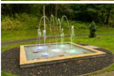
• 2020-10-07-Fontanny nad bulwarami uruchomione