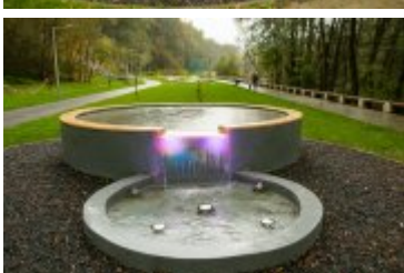
• 2020-10-07-Fontanny nad bulwarami uruchomione