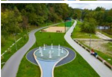
• 2020-10-07-Fontanny nad bulwarami uruchomione