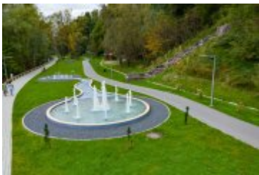
• 2020-10-07-Fontanny nad bulwarami uruchomione