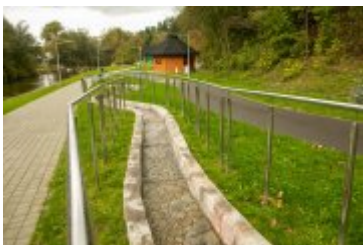
• 2020-10-07-Fontanny nad bulwarami uruchomione