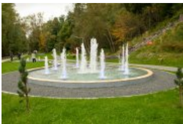
• 2020-10-07-Fontanny nad bulwarami uruchomione