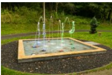
• 2020-10-07-Fontanny nad bulwarami uruchomione