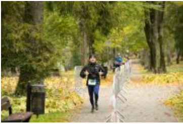
• 2020-10-18-Perły Małopolski