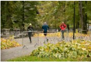
• 2020-10-18-Perły Małopolski