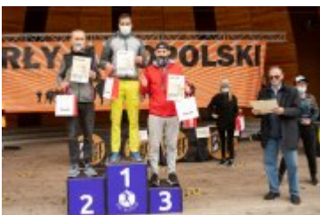
• 2020-10-18-Perły Małopolski