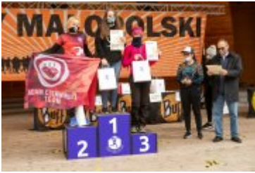
• 2020-10-18-Perły Małopolski