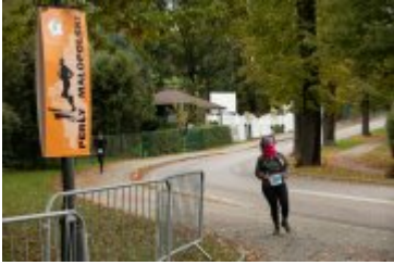
• 2020-10-18-Perły Małopolski