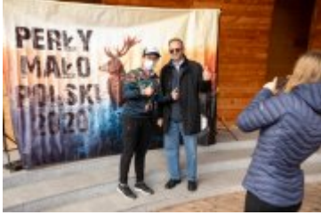
• 2020-10-18-Perły Małopolski