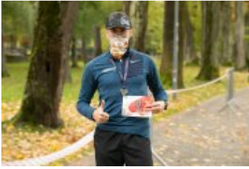
• 2020-10-18-Perły Małopolski