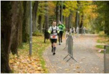
• 2020-10-18-Perły Małopolski