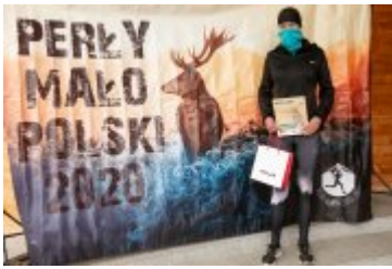
• 2020-10-18-Perły Małopolski