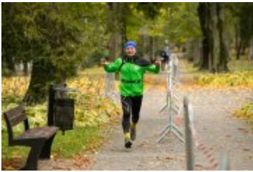
• 2020-10-18-Perły Małopolski