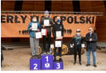
• 2020-10-18-Perły Małopolski