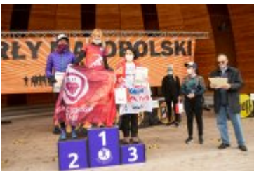
• 2020-10-18-Perły Małopolski