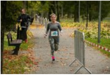
• 2020-10-18-Perły Małopolski