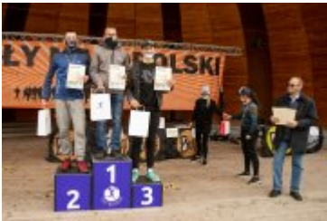
• 2020-10-18-Perły Małopolski