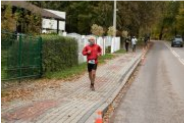
• 2020-10-18-Perły Małopolski