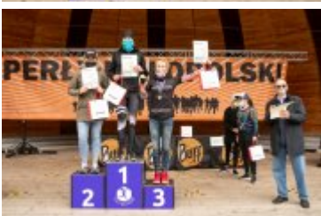
• 2020-10-18-Perły Małopolski