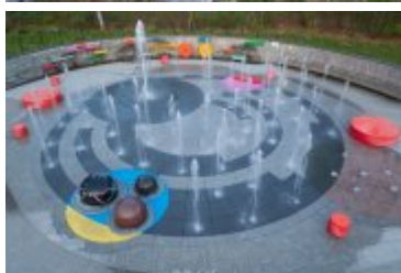
2025-04-23- Wodny plac zabaw otwarty!