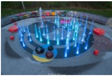
• 2025-04-23- Wodny plac zabaw otwarty!