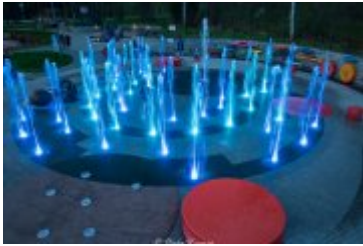
• 2025-04-23- Wodny plac zabaw otwarty!