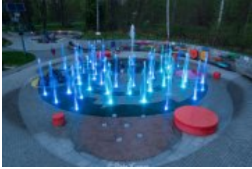
• 2025-04-23- Wodny plac zabaw otwarty!