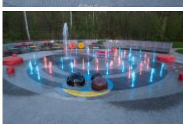
2025-04-23- Wodny plac zabaw otwarty!