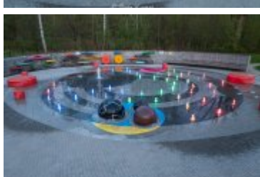
2025-04-23- Wodny plac zabaw otwarty!