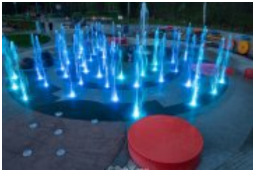
• 2025-04-23- Wodny plac zabaw otwarty!