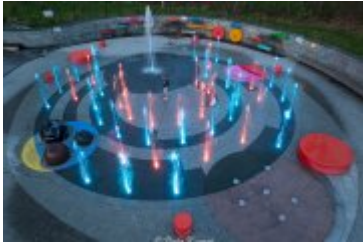
• 2025-04-23- Wodny plac zabaw otwarty!