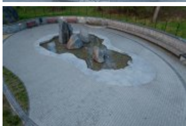
2025-04-23- Wodny plac zabaw otwarty!