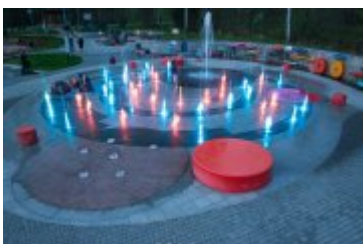
• 2025-04-23- Wodny plac zabaw otwarty!