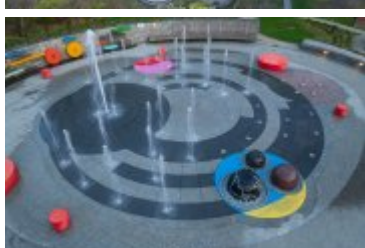
2025-04-23- Wodny plac zabaw otwarty!