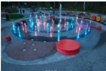
• 2025-04-23- Wodny plac zabaw otwarty!