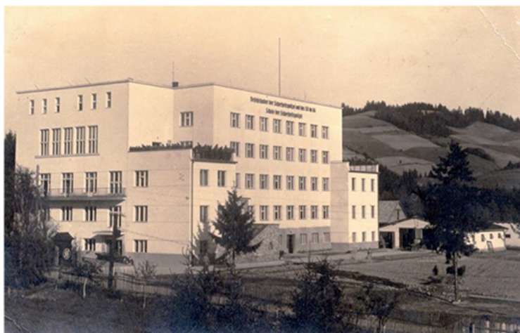
Willa „Tereska” w czasie okupacji niemieckiej

Założona przez Niemców szkoła, oprócz prowadzonej w niej działalności szkoleniowej, była również samowystarczalnym zakładem pracy. Posiadała gospodarstwo rolne, zakłady rzemieślnicze czy brygady budowlane. Pracownikami byli Polscy i żydowscy robotnicy przymusowi, których ściągano tutaj nawet transportami z Nowego Sącza. Praca nie była lekka i odbywała się w ciągłym poczuciu strachu o własne życie. Robotnicy byli bici i poniżani przez niemieckich i ukraińskich strażników. Najślabszych rozstrzeliwano.