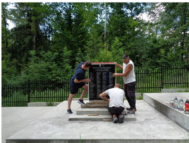
Montaż tablicy upamiętniającej żydowskie ofiary z czasów II wojny światowej

Na tablicy wypisano imiona i nazwiska oraz wiek 202 obywateli polskich żydowskiego pochodzenia, którzy zostali zamordowani w Rabce w czasie II wojny światowej. Większość wymienionych osób została zamordowana podczas masowych egzekucji przeprowadzonych przez załogę i kursantów niemieckiej Szkoły Dowódców Policji Bezpieczeństwa i Służby Bezpieczeństwa, które odbywały się w lasku za budynkiem szkoły. W ten symboliczny sposób w miejscu pamięci za willą „Tereska” zachowano ślad istnienia poszczególnych osób, o których, wedle niemieckiego planu, świat miał zapomnieć.