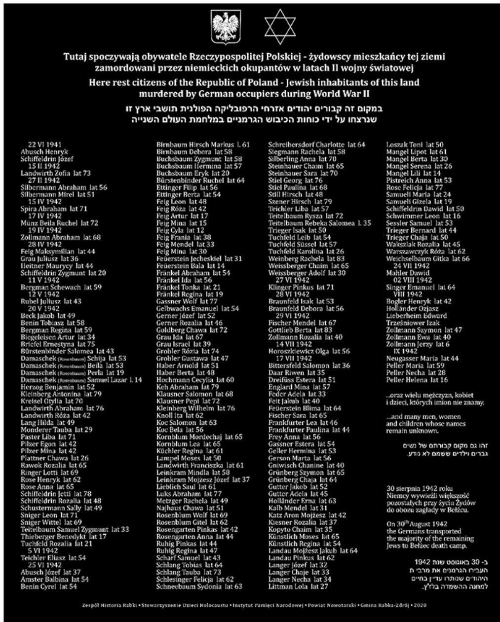
Projekt tablicy upamiętniającej żydowskie ofiary z czasów II wojny światowej