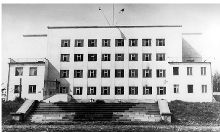
„Schody Rosenbauma” przed willą „Tereska”.

Materiały budowlane na te inwestycje pochodziły głównie z żydowskich cmentarzy, które znajdowały się w okolicy, między innymi z nekropolii w Jordanowie. Na rozkaz komendanta, z części płyt nagrobnych robotnicy wykonali wielkie dziesięciometrowe schody, prowadzące na plac przed szkołą. Zbudowane były z czarnego i białego marmuru. Czarny marmur ułożono w kształcie przypominającym orła z godła III Rzeszy.