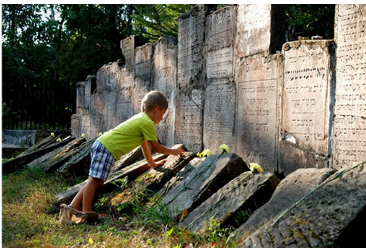
Fragment lapidarium na cmentarzu w lasku za willą „Tereska”.