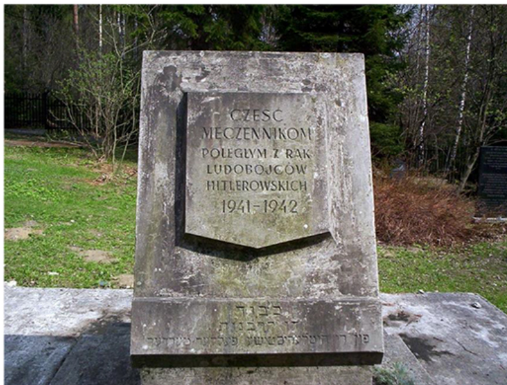
Pomnik z napisem „Cześć Męczennikom Poległym z Rąk Ludobójców Hitlerowskich 1941 – 1942”

miejscu zapadających się masowych mogił postawiono betonowe nagrobki. Na największym z grobów ustawiono pomnik z napisem Cześć Męczennikom Poległym z Rąk Ludobójców Hitlerowskich 1941-1942. Na podstawie pomnika umieszczono napis w języku hebrajskim. Teren cmentarza został otoczony siatką ogrodzeniową. Cmentarz zajmuje tylko część leśnej polany, na której dokonywano zbrodni. Groby pomordowanych znajdują się również w innych częściach lasu.