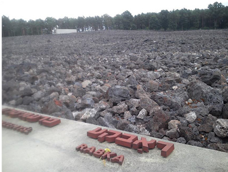
Fragment pomnika ofiar obozu zagłady w Bełżcu. Rdzawymi literami zaznaczono transport z Rabki.

30 sierpnia 1942 roku wszystkich pozostałych przy życiu żydowskich mieszkańców Rabki Niemcy wywieźli do obozu zagłady w Bełżcu. Pozostawiono jedynie około 200 mężczyzn, którzy mieli wykonywać prace w szkole. Jeżeli komuś udało się ukryć przed deportacją, miał niełatwe zadanie. Niemcy nadal szukali ukrywających się Żydów. Każdy kto wiedział o takich Żydach i zatajał tę informację, musiał liczyć się z karą śmierci.