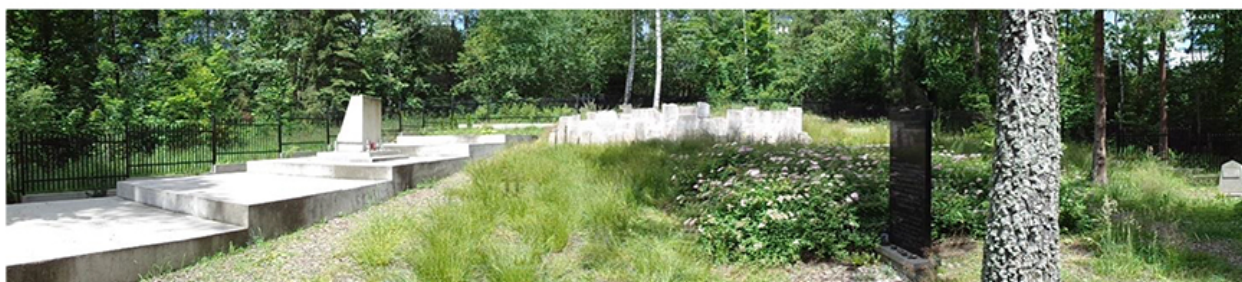
Cmentarz – miejsce pamięci w lasu za willą „Tereska” w Rabce-Zdroju

Dlatego przez pamięć i szacunek dla ofiar zastanówmy się nad sobą. Spójrzmy w głąb siebie. Przyjrzyjmy się własnym uczynom. Czy jest w nas coś co należałoby zmienić? Czy nasze zachowanie wyzwała w ludziach dobro, czy też wyzwała zło, które może doprowadzić do podobnych nieszczęść w przyszłości? Odwiedzając to miejsce wynieśmy z jego historii lekcję dla siebie.