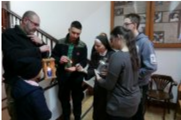
• 2022-12-23-Betlejemskie Światło Pokoju