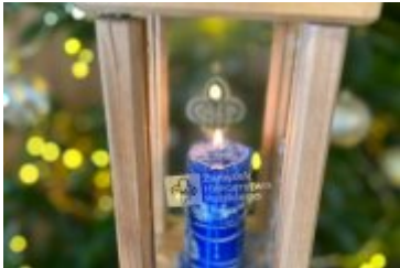
• 2022-12-23-Betlejemskie Światło Pokoju