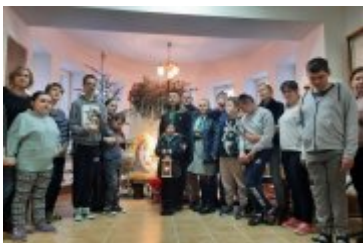
• 2022-12-23-Betlejemskie Światło Pokoju