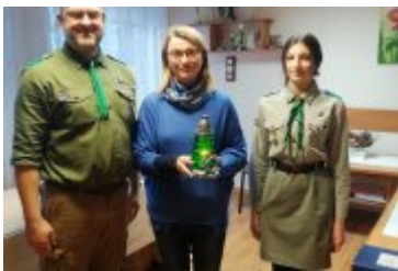
• 2022-12-23-Betlejemskie Światło Pokoju