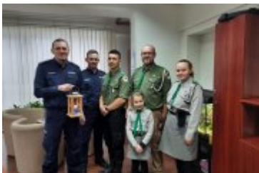
• 2022-12-23-Betlejemskie Światło Pokoju