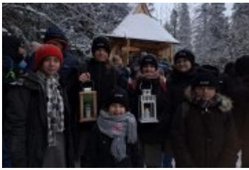
• 2022-12-23-Betlejemskie Światło Pokoju