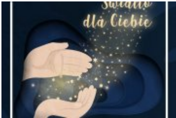
• 2022-12-23-Betlejemskie Światło Pokoju