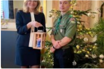
• 2022-12-23-Betlejemskie Światło Pokoju