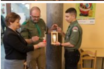
• 2022-12-23-Betlejemskie Światło Pokoju