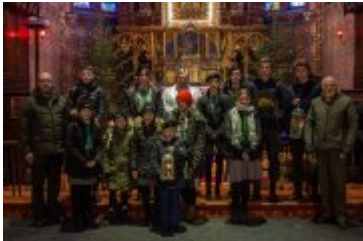
• 2022-12-23-Betlejemskie Światło Pokoju