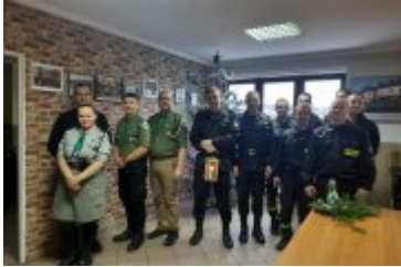
• 2022-12-23-Betlejemskie Światło Pokoju