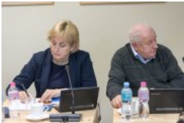
• 2022-12-29-LXI Sesja Rady Miejskiej w Rabce - Zdroju