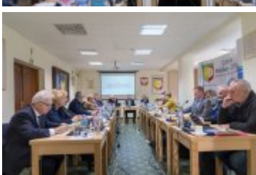
• 2022-12-29-LXI Sesja Rady Miejskiej w Rabce - Zdroju