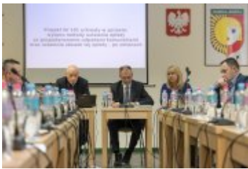
• 2022-12-29-LXI Sesja Rady Miejskiej w Rabce - Zdroju