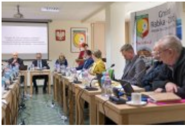
• 2022-12-29-LXI Sesja Rady Miejskiej w Rabce - Zdroju