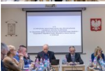
• 2022-12-29-LXI Sesja Rady Miejskiej w Rabce - Zdroju