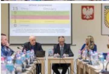
• 2022-12-29-LXI Sesja Rady Miejskiej w Rabce - Zdroju