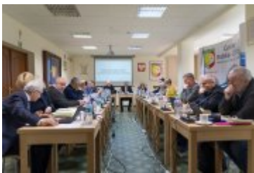
• 2022-12-29-LXI Sesja Rady Miejskiej w Rabce - Zdroju