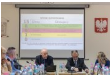
• 2022-12-29-LXI Sesja Rady Miejskiej w Rabce - Zdroju