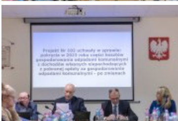
• 2022-12-29-LXI Sesja Rady Miejskiej w Rabce - Zdroju