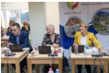
• 2022-12-29-LXI Sesja Rady Miejskiej w Rabce - Zdroju