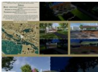
• 2025-07-05- Projekt "Mostki na Słońce"