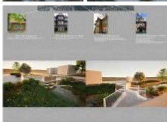
2025-07-05- Projekt "Mostki na Słońce"