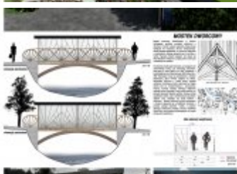
• 2025-07-05- Projekt "Mostki na Słońce"