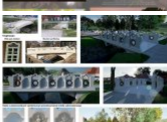
• 2025-07-05- Projekt "Mostki na Słońce"