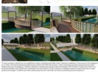
• 2025-07-05- Projekt "Mostki na Słońce"