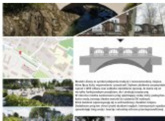
2025-07-05- Projekt "Mostki na Słońce"