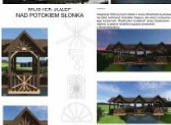
• 2025-07-05- Projekt "Mostki na Słońce"