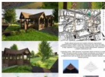
2025-07-05- Projekt "Mostki na Słońce"