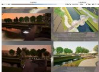
• 2025-07-05- Projekt "Mostki na Słońce"