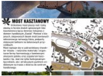
• 2025-07-05- Projekt "Mostki na Słońce"