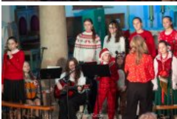
• 2025-02-02- XIV Rabczańskie Kołędowanie