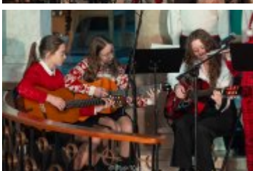
• 2025-02-02- XIV Rabczańskie Kołędowanie