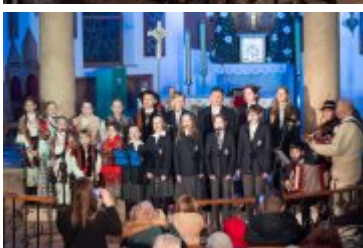
• 2025-02-02- XIV Rabczańskie Kołędowanie