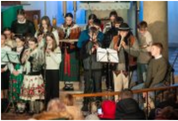
• 2025-02-02- XIV Rabczańskie Kołędowanie