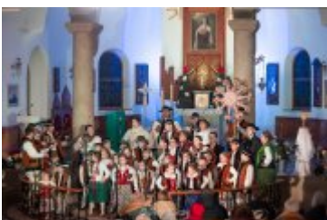
• 2025-02-02- XIV Rabczańskie Kołędowanie