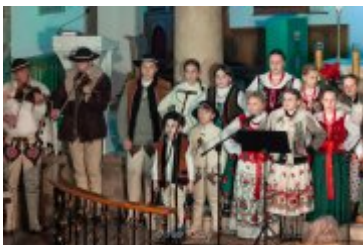
• 2025-02-02- XIV Rabczańskie Kołędowanie