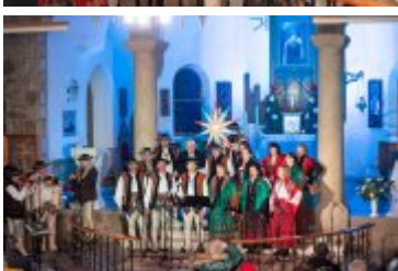
• 2025-02-02- XIV Rabczańskie Kołędowanie