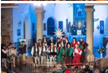
• 2025-02-02- XIV Rabczańskie Kołędowanie