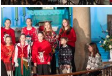
• 2025-02-02- XIV Rabczańskie Kołędowanie