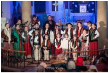
• 2025-02-02- XIV Rabczańskie Kołędowanie