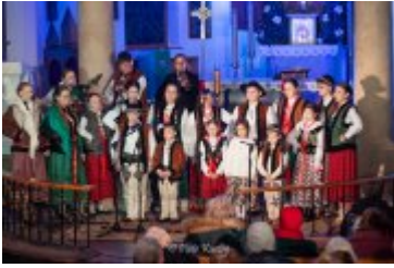
• 2025-02-02- XIV Rabczańskie Kołędowanie