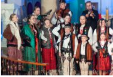
• 2025-02-02- XIV Rabczańskie Kołędowanie