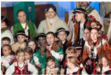
• 2025-02-02- XIV Rabczańskie Kołędowanie