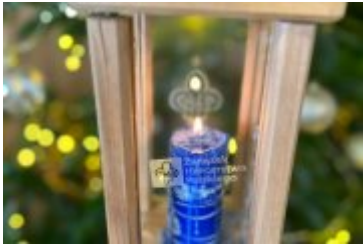
• 2022-12-23-Betlejemskie Światło Pokoju