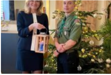
• 2022-12-23-Betlejemskie Światło Pokoju