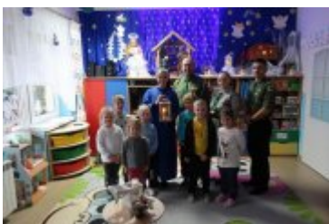
• 2022-12-23-Betlejemskie Światło Pokoju