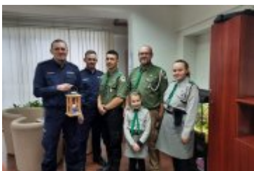
• 2022-12-23-Betlejemskie Światło Pokoju