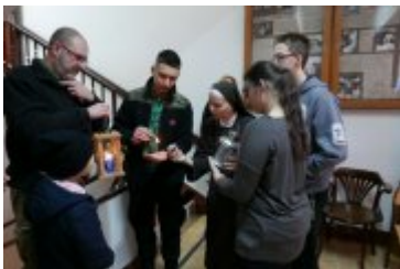
• 2022-12-23-Betlejemskie Światło Pokoju