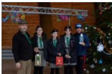
• 2022-12-23-Betlejemskie Światło Pokoju