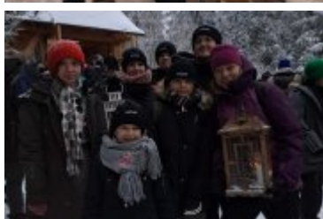
• 2022-12-23-Betlejemskie Światło Pokoju