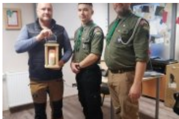
• 2022-12-23-Betlejemskie Światło Pokoju