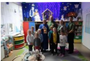
• 2022-12-23-Betlejemskie Światło Pokoju