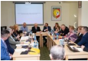
• 2019-01-31-IV Sesja Rady Miejskiej w Rabce-Zdroju