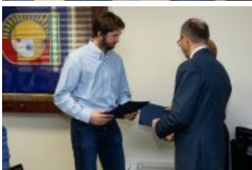
• 2019-01-31-IV Sesja Rady Miejskiej w Rabce-Zdroju