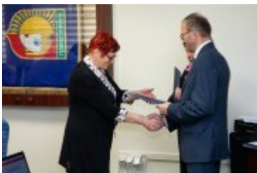
• 2019-01-31-IV Sesja Rady Miejskiej w Rabce-Zdroju