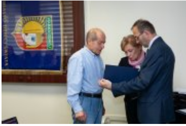
• 2019-01-31-IV Sesja Rady Miejskiej w Rabce-Zdroju