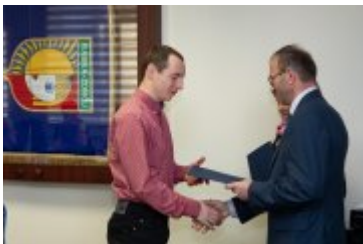
• 2019-01-31-IV Sesja Rady Miejskiej w Rabce-Zdroju