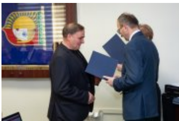
• 2019-01-31-IV Sesja Rady Miejskiej w Rabce-Zdroju