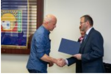
• 2019-01-31-IV Sesja Rady Miejskiej w Rabce-Zdroju