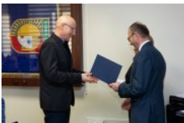
• 2019-01-31-IV Sesja Rady Miejskiej w Rabce-Zdroju