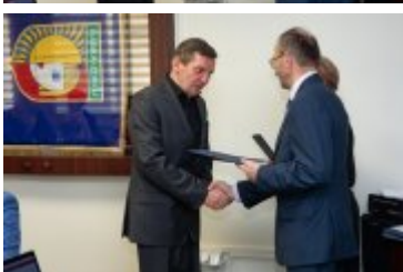
• 2019-01-31-IV Sesja Rady Miejskiej w Rabce-Zdroju