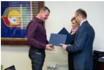
• 2019-01-31-IV Sesja Rady Miejskiej w Rabce-Zdroju