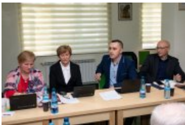
• 2019-01-31-IV Sesja Rady Miejskiej w Rabce-Zdroju