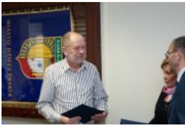
• 2019-01-31-IV Sesja Rady Miejskiej w Rabce-Zdroju