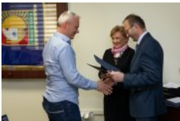
• 2019-01-31-IV Sesja Rady Miejskiej w Rabce-Zdroju