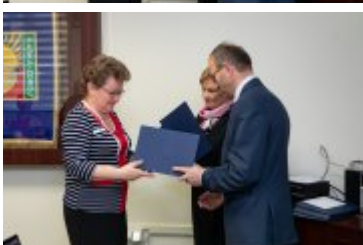
• 2019-01-31-IV Sesja Rady Miejskiej w Rabce-Zdroju