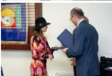
• 2019-01-31-IV Sesja Rady Miejskiej w Rabce-Zdroju