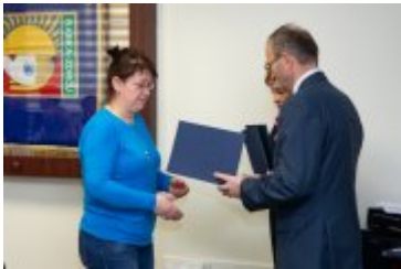
• 2019-01-31-IV Sesja Rady Miejskiej w Rabce-Zdroju