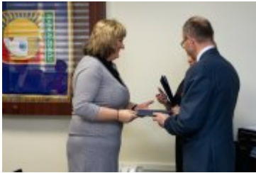
• 2019-01-31-IV Sesja Rady Miejskiej w Rabce-Zdroju