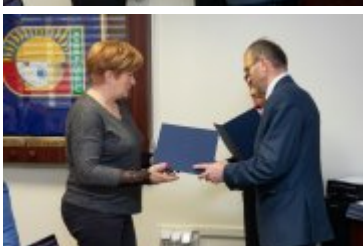
• 2019-01-31-IV Sesja Rady Miejskiej w Rabce-Zdroju