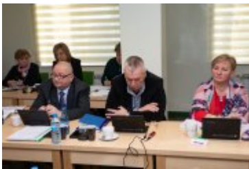
• 2019-01-31-IV Sesja Rady Miejskiej w Rabce-Zdroju