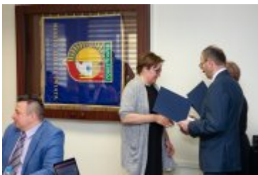
• 2019-01-31-IV Sesja Rady Miejskiej w Rabce-Zdroju