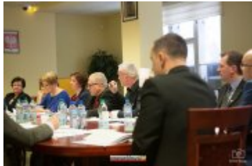
• XXVII sesja Rady Miejskiej w Rabce-Zdroju