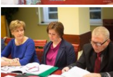
• XXVII sesja Rady Miejskiej w Rabce-Zdroju