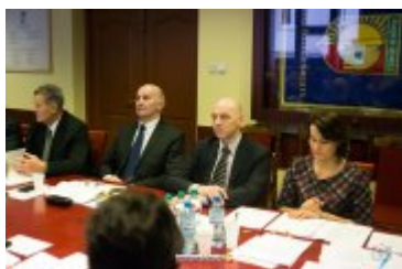
• XXVII sesja Rady Miejskiej w Rabce-Zdroju