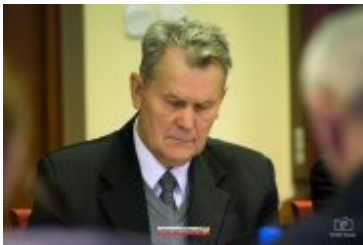
• XXVII sesja Rady Miejskiej w Rabce-Zdroju