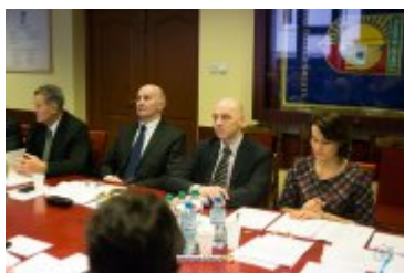
• XXVII sesja Rady Miejskiej w Rabce-Zdroju