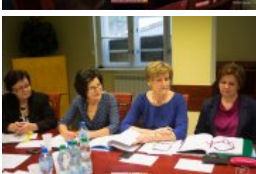
• XXVII sesja Rady Miejskiej w Rabce-Zdroju