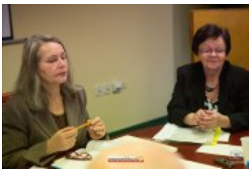
• XXVII sesja Rady Miejskiej w Rabce-Zdroju