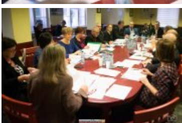
• XXVII sesja Rady Miejskiej w Rabce-Zdroju