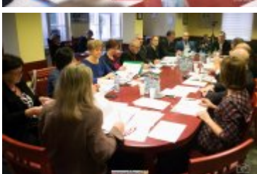
• XXVII sesja Rady Miejskiej w Rabce-Zdroju