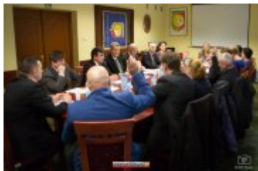
• XXVII sesja Rady Miejskiej w Rabce-Zdroju