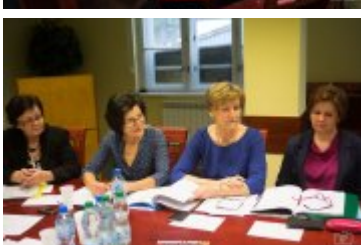
• XXVII sesja Rady Miejskiej w Rabce-Zdroju