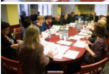
• XXVII sesja Rady Miejskiej w Rabce-Zdroju