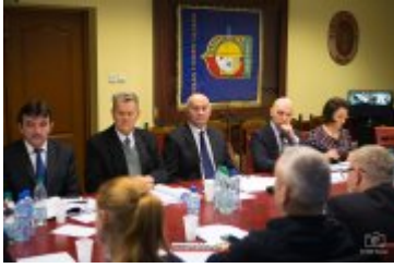
• XXVII sesja Rady Miejskiej w Rabce-Zdroju