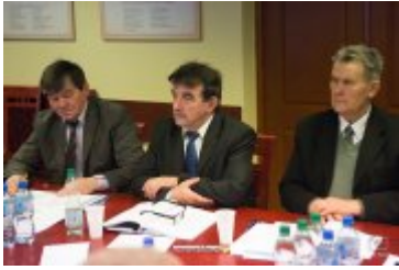
• XXVII sesja Rady Miejskiej w Rabce-Zdroju