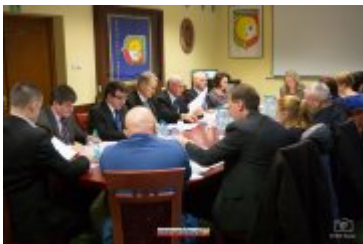
• XXVII sesja Rady Miejskiej w Rabce-Zdroju