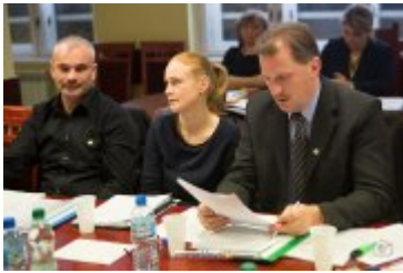
• XXVII sesja Rady Miejskiej w Rabce-Zdroju