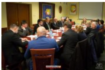
• XXVII sesja Rady Miejskiej w Rabce-Zdroju