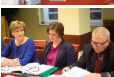
• XXVII sesja Rady Miejskiej w Rabce-Zdroju