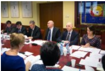
• XXVII sesja Rady Miejskiej w Rabce-Zdroju