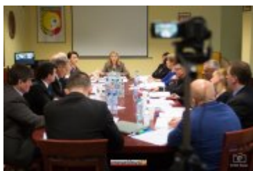
• XXVII sesja Rady Miejskiej w Rabce-Zdroju