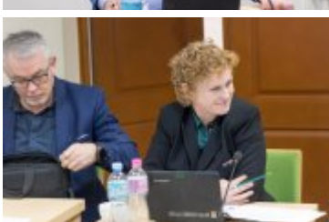
• 2022-12-29-LXI Sesja Rady Miejskiej w Rabce - Zdroju