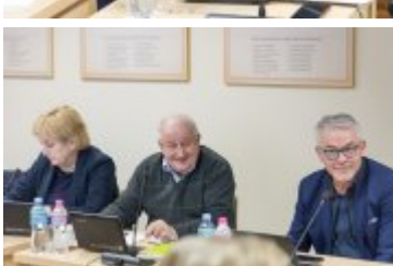
• 2022-12-29-LXI Sesja Rady Miejskiej w Rabce - Zdroju