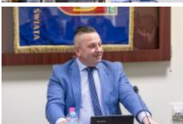
• 2022-12-29-LXI Sesja Rady Miejskiej w Rabce - Zdroju