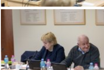
• 2022-12-29-LXI Sesja Rady Miejskiej w Rabce - Zdroju