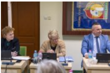
• 2022-12-29-LXI Sesja Rady Miejskiej w Rabce - Zdroju