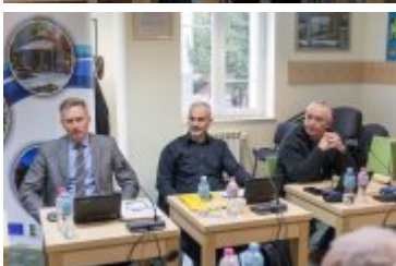
• 2022-12-29-LXI Sesja Rady Miejskiej w Rabce - Zdroju