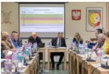
• 2022-12-29-LXI Sesja Rady Miejskiej w Rabce - Zdroju