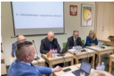
• 2022-12-29-LXI Sesja Rady Miejskiej w Rabce - Zdroju