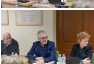
• 2022-12-29-LXI Sesja Rady Miejskiej w Rabce - Zdroju