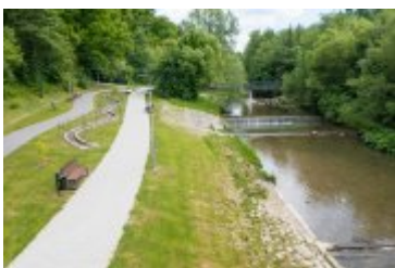
• 2021-06-11-Fontanny nad bulwarami uruchomione