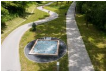
• 2021-06-11-Fontanny nad bulwarami uruchomione