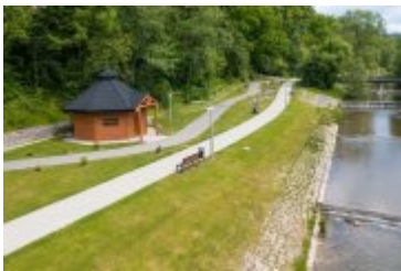
• 2021-06-11-Fontanny nad bulwarami uruchomione