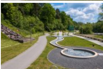
• 2021-06-11-Fontanny nad bulwarami uruchomione