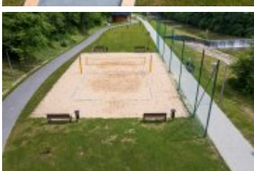
• 2021-06-11-Fontanny nad bulwarami uruchomione