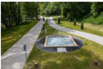
• 2021-06-11-Fontanny nad bulwarami uruchomione