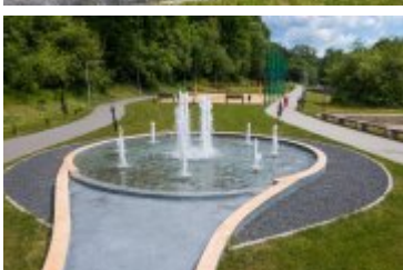
• 2021-06-11-Fontanny nad bulwarami uruchomione