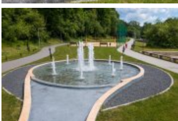
• 2021-06-11-Fontanny nad bulwarami uruchomione