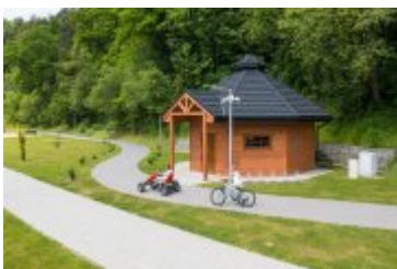
• 2021-06-11-Fontanny nad bulwarami uruchomione