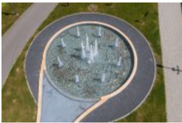
• 2021-06-11-Fontanny nad bulwarami uruchomione