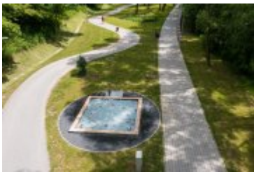
• 2021-06-11-Fontanny nad bulwarami uruchomione