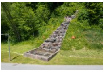
• 2021-06-11-Fontanny nad bulwarami uruchomione