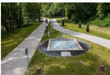
• 2021-06-11-Fontanny nad bulwarami uruchomione