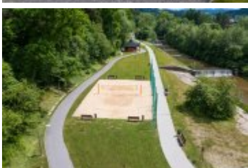
• 2021-06-11-Fontanny nad bulwarami uruchomione