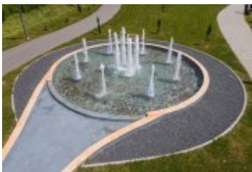
• 2021-06-11-Fontanny nad bulwarami uruchomione