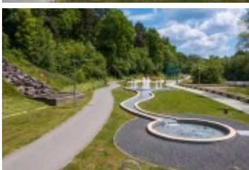
• 2021-06-11-Fontanny nad bulwarami uruchomione