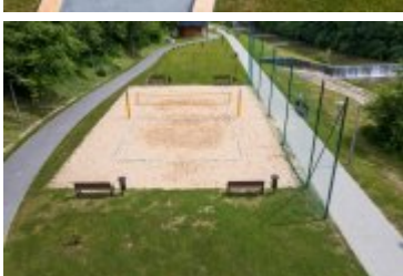
• 2021-06-11-Fontanny nad bulwarami uruchomione