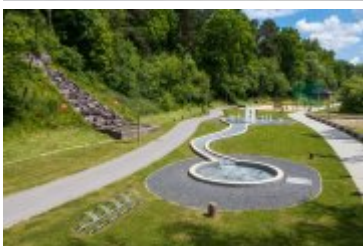
• 2021-06-11-Fontanny nad bulwarami uruchomione