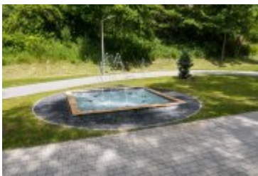
• 2021-06-11-Fontanny nad bulwarami uruchomione