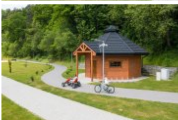
• 2021-06-11-Fontanny nad bulwarami uruchomione