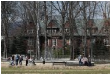
• 2018-04-08-Spacerkiem po rabczańskim Parku Zdrojowym