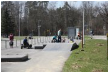
• 2018-04-08-Spacerkiem po rabczańskim Parku Zdrojowym