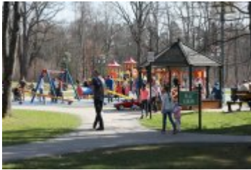
• 2018-04-08-Spacerkiem po rabczańskim Parku Zdrojowym