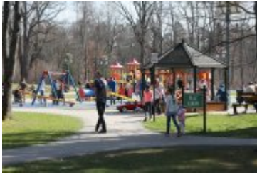
• 2018-04-08-Spacerkiem po rabczańskim Parku Zdrojowym