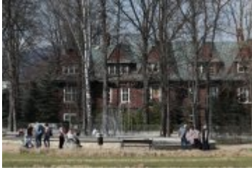
• 2018-04-08-Spacerkiem po rabczańskim Parku Zdrojowym