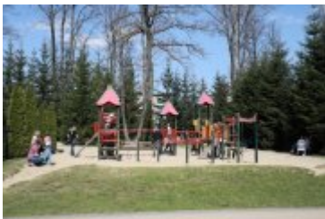
• 2018-04-08-Spacerkiem po rabczańskim Parku Zdrojowym