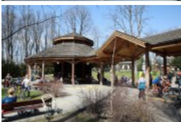
• 2018-04-08-Spacerkiem po rabczańskim Parku Zdrojowym