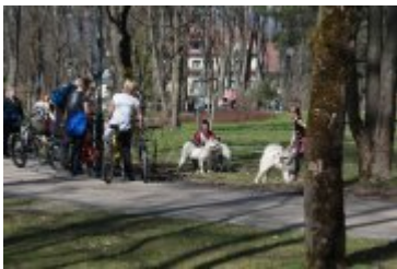
• 2018-04-08-Spacerkiem po rabczańskim Parku Zdrojowym