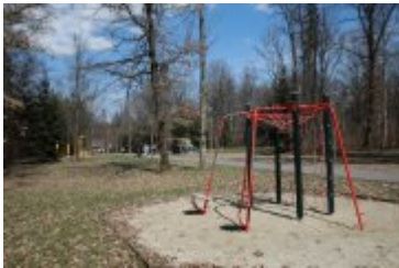
• 2018-04-08-Spacerkiem po rabczańskim Parku Zdrojowym