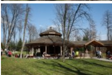
• 2018-04-08-Spacerkiem po rabczańskim Parku Zdrojowym