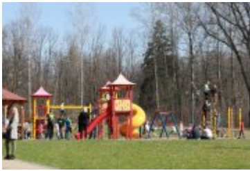
• 2018-04-08-Spacerkiem po rabczańskim Parku Zdrojowym