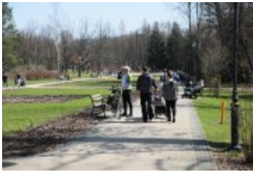
• 2018-04-08-Spacerkiem po rabczańskim Parku Zdrojowym