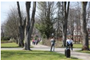
• 2018-04-08-Spacerkiem po rabczańskim Parku Zdrojowym