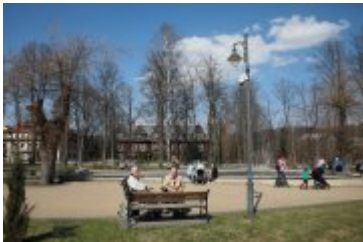
• 2018-04-08-Spacerkiem po rabczańskim Parku Zdrojowym