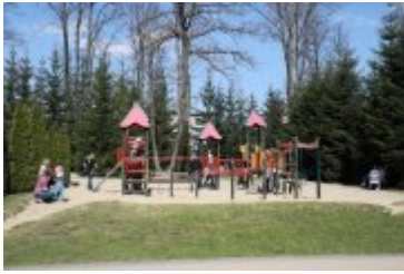
• 2018-04-08-Spacerkiem po rabczańskim Parku Zdrojowym