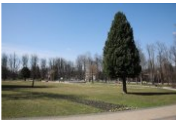
• 2018-04-08-Spacerkiem po rabczańskim Parku Zdrojowym