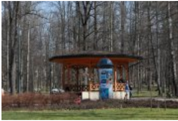
• 2018-04-08-Spacerkiem po rabczańskim Parku Zdrojowym