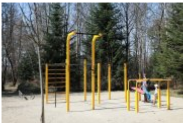
• 2018-04-08-Spacerkiem po rabczańskim Parku Zdrojowym