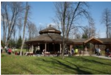
• 2018-04-08-Spacerkiem po rabczańskim Parku Zdrojowym