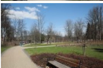
• 2018-04-08-Spacerkiem po rabczańskim Parku Zdrojowym