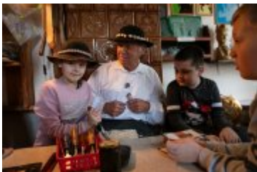
• 2018-10-09-Festiwal Sztuki Ludowej i Ginących Zawodów