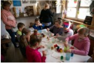
• 2018-10-09-Festiwal Sztuki Ludowej i Ginących Zawodów