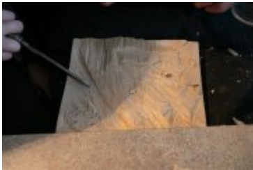
• 2018-10-09-Festiwal Sztuki Ludowej i Ginących Zawodów