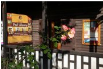
• 2018-10-09-Festiwal Sztuki Ludowej i Ginących Zawodów