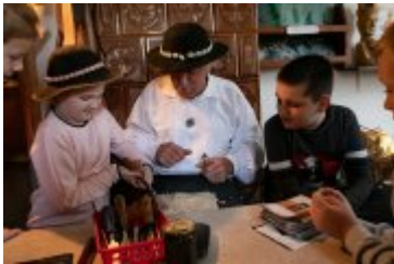
• 2018-10-09-Festiwal Sztuki Ludowej i Ginących Zawodów