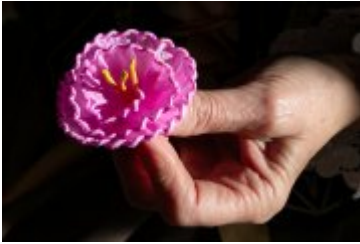
• 2018-10-09-Festiwal Sztuki Ludowej i Ginących Zawodów