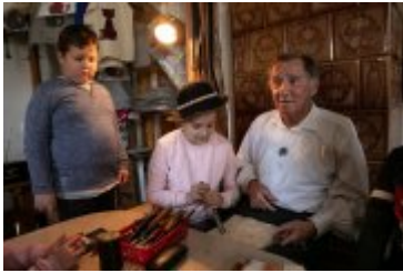
• 2018-10-09-Festiwal Sztuki Ludowej i Ginących Zawodów