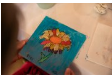
• 2018-10-09-Festiwal Sztuki Ludowej i Ginących Zawodów