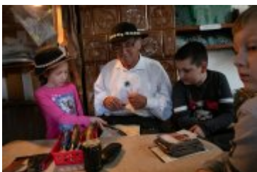
• 2018-10-09-Festiwal Sztuki Ludowej i Ginących Zawodów