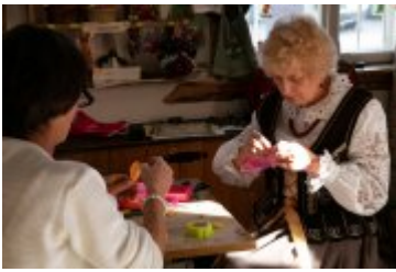
• 2018-10-09-Festiwal Sztuki Ludowej i Ginących Zawodów