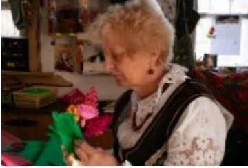
• 2018-10-09-Festiwal Sztuki Ludowej i Ginących Zawodów