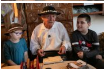
• 2018-10-09-Festiwal Sztuki Ludowej i Ginących Zawodów