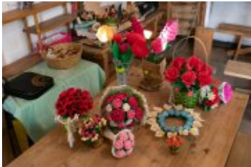
• 2018-10-09-Festiwal Sztuki Ludowej i Ginących Zawodów