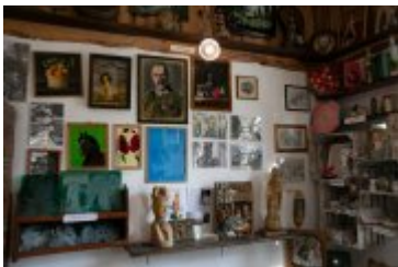
• 2018-10-09-Festiwal Sztuki Ludowej i Ginących Zawodów