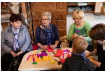
• 2018-10-09-Festiwal Sztuki Ludowej i Ginących Zawodów