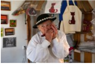
• 2018-10-09-Festiwal Sztuki Ludowej i Ginących Zawodów