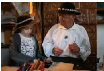
• 2018-10-09-Festiwal Sztuki Ludowej i Ginących Zawodów