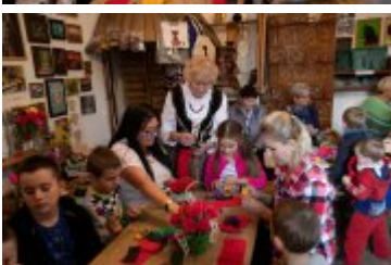
• 2018-10-09-Festiwal Sztuki Ludowej i Ginących Zawodów