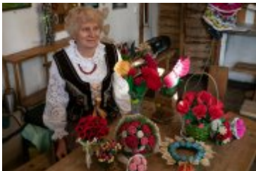
• 2018-10-09-Festiwal Sztuki Ludowej i Ginących Zawodów