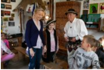
• 2018-10-09-Festiwal Sztuki Ludowej i Ginących Zawodów