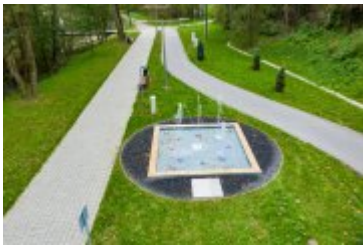
• 2020-10-07-Fontanny nad bulwarami uruchomione