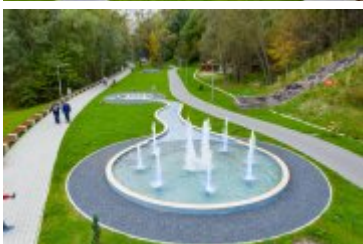
• 2020-10-07-Fontanny nad bulwarami uruchomione