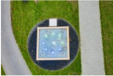
• 2020-10-07-Fontanny nad bulwarami uruchomione