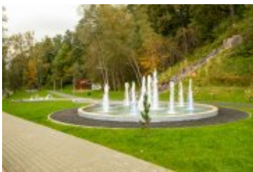
• 2020-10-07-Fontanny nad bulwarami uruchomione