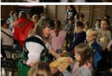
• 2019-11-18-Górale i Krakowiacy