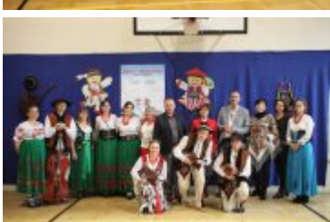
• 2019-11-18-Górale i Krakowiacy