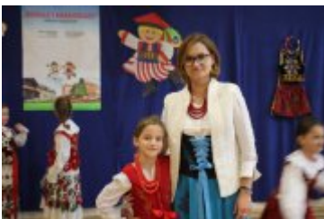
• 2019-11-18-Górale i Krakowiacy