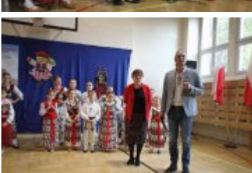
• 2019-11-18-Górale i Krakowiacy