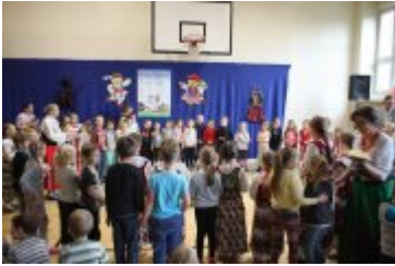
• 2019-11-18-Górale i Krakowiacy