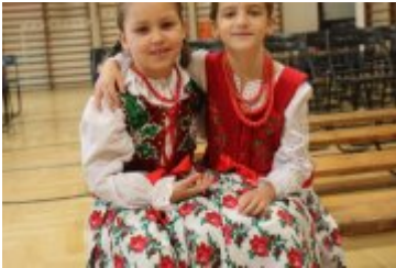
• 2019-11-18-Górale i Krakowiacy