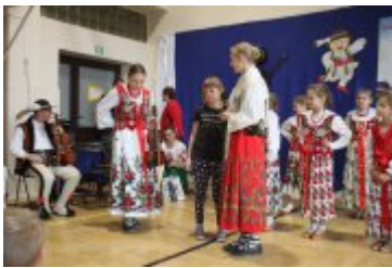
• 2019-11-18-Górale i Krakowiacy