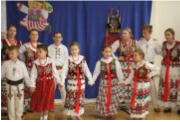
• 2019-11-18-Górale i Krakowiacy