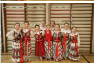
• 2019-11-18-Górale i Krakowiacy