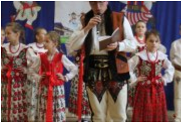
• 2019-11-18-Górale i Krakowiacy