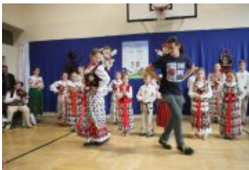
• 2019-11-18-Górale i Krakowiacy