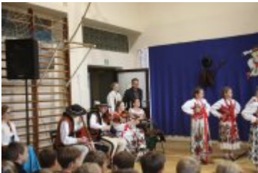
• 2019-11-18-Górale i Krakowiacy