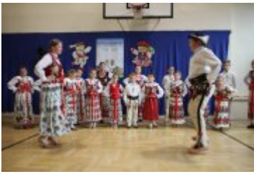
• 2019-11-18-Górale i Krakowiacy