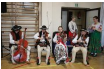
• 2019-11-18-Górale i Krakowiacy