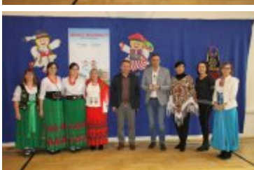
• 2019-11-18-Górale i Krakowiacy