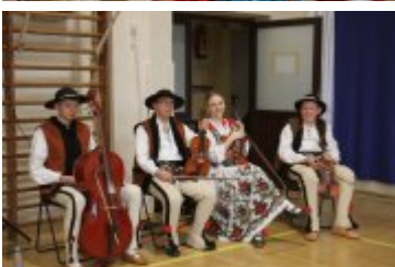
• 2019-11-18-Górale i Krakowiacy