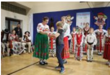
• 2019-11-18-Górale i Krakowiacy