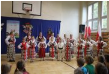
• 2019-11-18-Górale i Krakowiacy