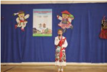
• 2019-11-18-Górale i Krakowiacy