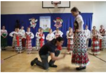
• 2019-11-18-Górale i Krakowiacy