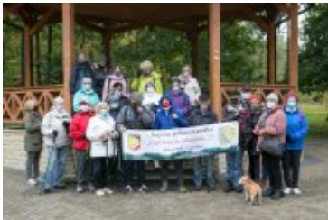
• 2020-10-14-IV Rajd im. Juliana Kawalca