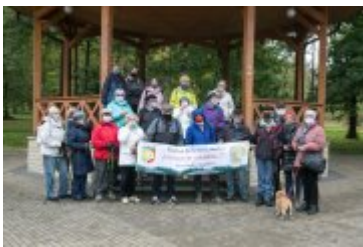
• 2020-10-14-IV Rajd im. Juliana Kawalca