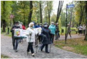
• 2020-10-14-IV Rajd im. Juliana Kwalca