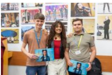
• 2024-05-31-Koncert Sary James w Amfiteatrze