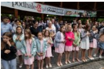
2024-05-31-Koncert Sary James w Amfiteatrze