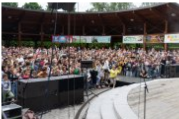
2024-05-31-Koncert Sary James w Amfiteatrze