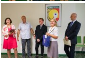
• 2018-07-26-Rabczańscy sportowcy na Sesji Rady Miejskiej