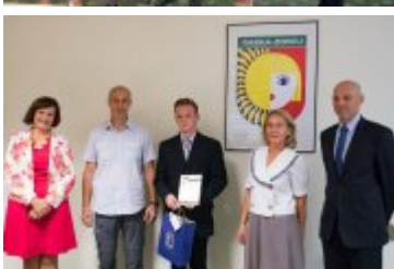
• 2018-07-26-Rabczańscy sportowcy na Sesji Rady Miejskiej