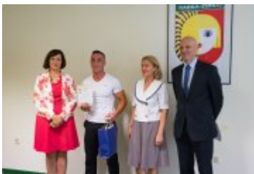
• 2018-07-26-Rabczańscy sportowcy na Sesji Rady Miejskiej