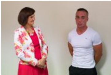
• 2018-07-26-Rabczańscy sportowcy na Sesji Rady Miejskiej