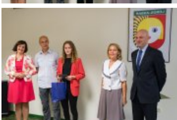
• 2018-07-26-Rabczańscy sportowcy na Sesji Rady Miejskiej