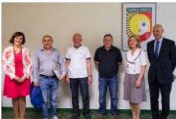
• 2018-07-26-Rabczańscy sportowcy na Sesji Rady Miejskiej