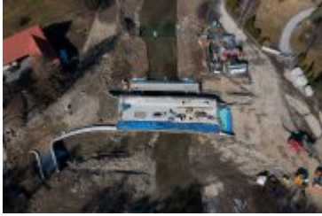
• 2022-03-14-Postępy prac na budowie mostu nad Poniczanką