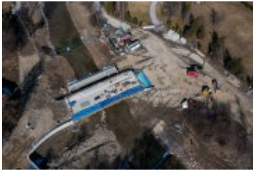
• 2022-03-14-Postępy prac na budowie mostu nad Poniczanką