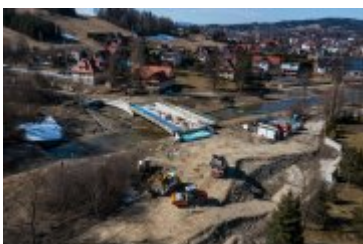
• 2022-03-14-Postępy prac na budowie mostu nad Poniczanką