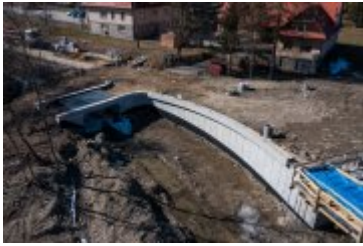
• 2022-03-14-Postępy prac na budowie mostu nad Poniczanką