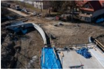
• 2022-03-14-Postępy prac na budowie mostu nad Poniczanką