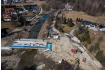
• 2022-03-14-Postępy prac na budowie mostu nad Poniczanką