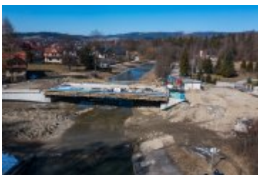
• 2022-03-14-Postępy prac na budowie mostu nad Poniczanką