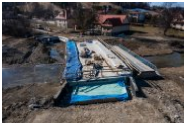
• 2022-03-14-Postępy prac na budowie mostu nad Poniczanką