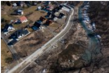
• 2022-03-14-Postępy prac na budowie mostu nad Poniczanką