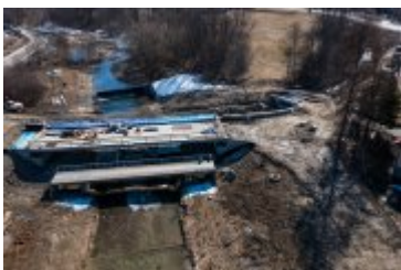
• 2022-03-14-Postępy prac na budowie mostu nad Poniczanką