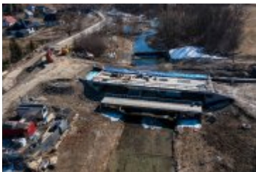
• 2022-03-14-Postępy prac na budowie mostu nad Poniczanką