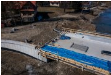
• 2022-03-14-Postępy prac na budowie mostu nad Poniczanką