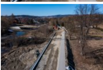
• 2022-03-14-Postępy prac na budowie mostu nad Poniczanką