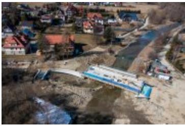
• 2022-03-14-Postępy prac na budowie mostu nad Poniczanką