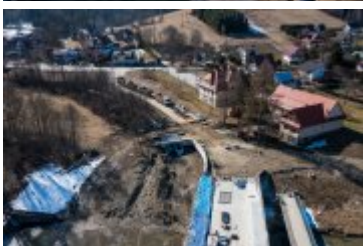
• 2022-03-14-Postępy prac na budowie mostu nad Poniczanką