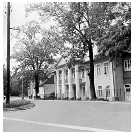
Willa „Luboń”, w tle willa „Trzy Róże”