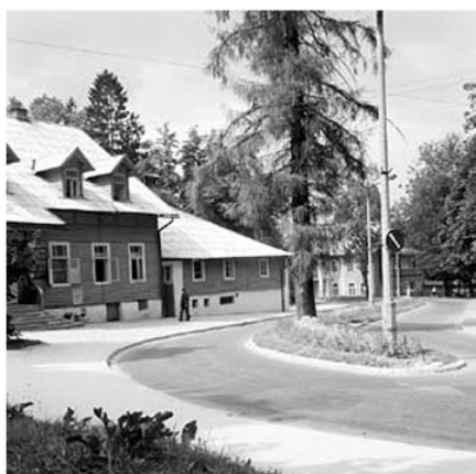
Restauracja „Pod Gwiazdą”