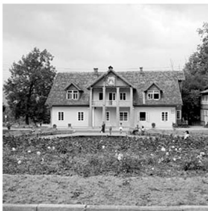
Willa „Trzy Róże”