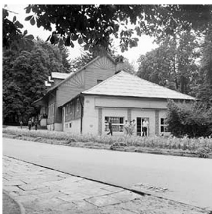
Kawiarnia „Pod Kasztanami”, w tle restauracja „Pod Gwiazdą”