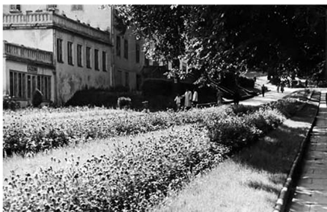
Deptak Zdrojowy – w tle łaźienki w willi „Pod Matką Boską”