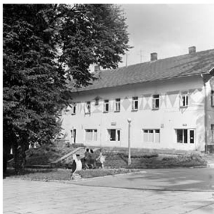
Willa „Pod Matką Boską” przy Deptaku Zdrojowym