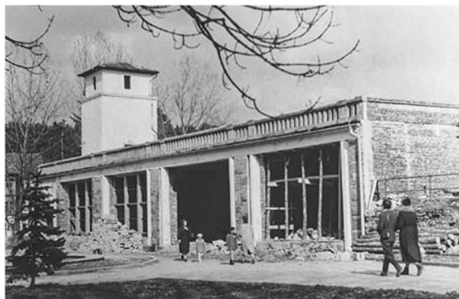
Rozbudowa bylej pijalni wód mineralnych