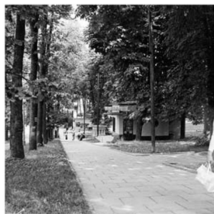
Alejka do Parku Zdrojowego