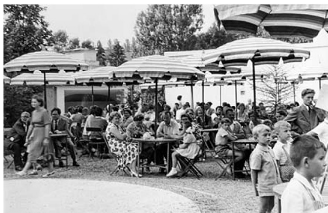
Parasole przy kawiarni „Zdrojowej”