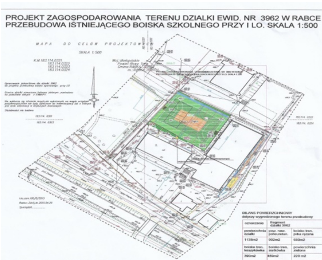
Boisko przy I LO (zadanie powiatu)

skrzyżowaniu ulic Sąddecka i Kasprowicz (zadanie powiatu i gminy)