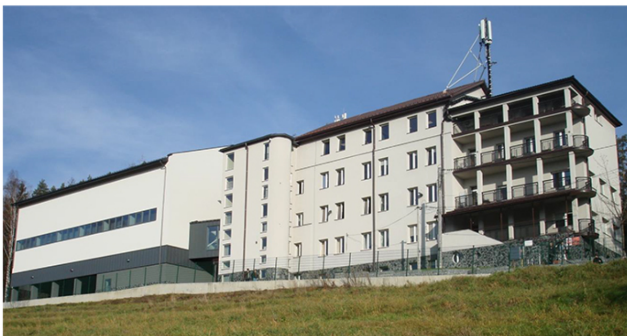
Sala gimnastyczna i budynek Zespołu Szkół im.ks.prof.Józefa Tischnera (II LO) (Fot. 11)