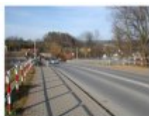
Most na Rabie (Fot. 13)