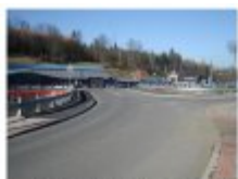
Most na Pociosze (Fot. 12)