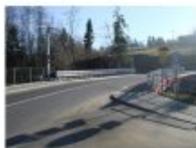
Most w Różawce (Fot. 14)