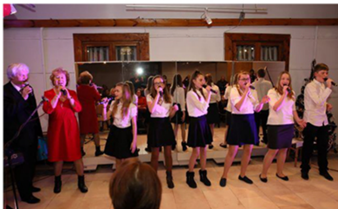
Triolki (Fot. 17)

Kwoty podane w tekście zaokrąglono do tysięcy