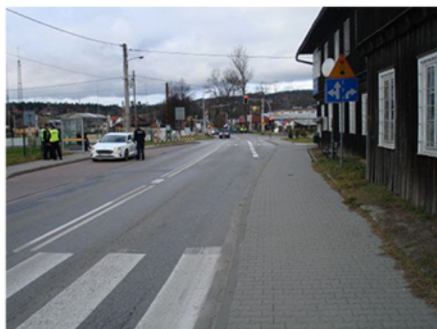
Jedna z powiatowych dróg w Rabce-Zdrój(Fot. 15)