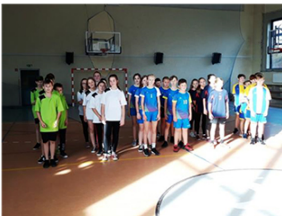
Igrzyska Młodzieży Szkolnej Ośrodka Sportowego Rabka-Zdrój w Koszykówce Dziewcząt i Chłopców (Fot.16)