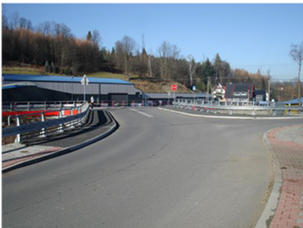
Most na Poniczance (Fot. 12)