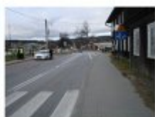
Łączna z powiatowych dróg w Rabce-Zdroju (Fot. 15)