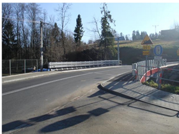
Most w Rdzawce (Fot. 14)