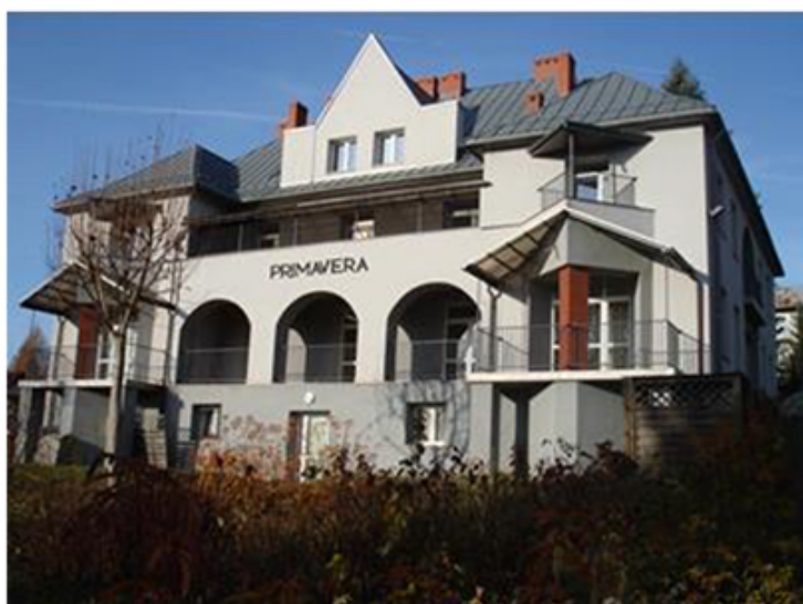
Przychodnia Psychologiczno-Pedagogiczna (Fot.4) i Środowiskowy Dom Samopomocy "Radość Życia"