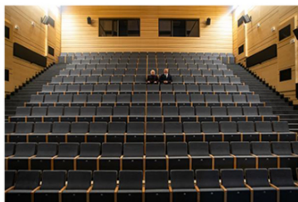
Teatr Lalek „Rabcio” (Fot. 5,6)