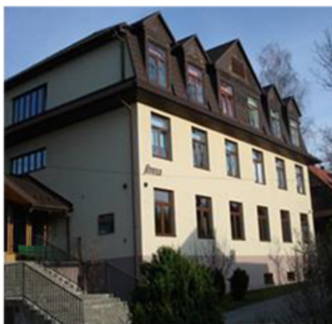
I LO im. E. Romera -Budynki „Jaworzyna” i „Anna” (Fot. 7,8)