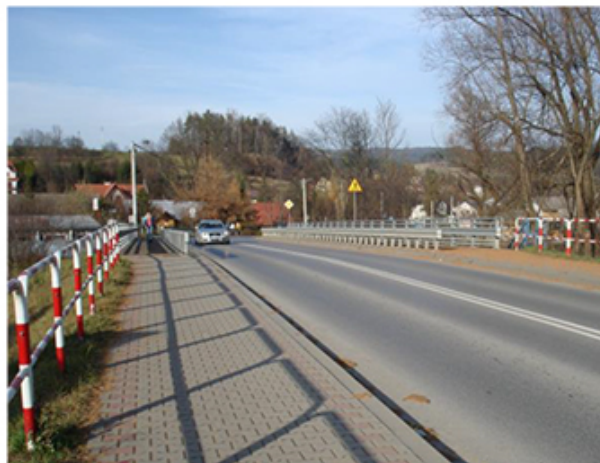
Most na Rabie (Fot. 13)