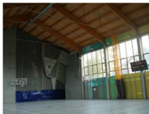
Sala gimnastyczna I LO im. E. Romera (Fot. 9,10)