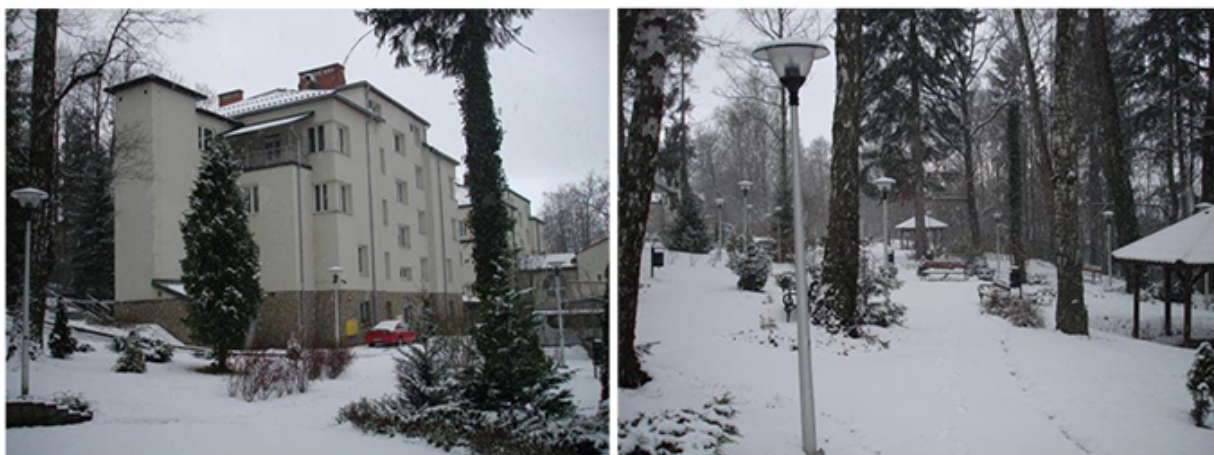
Dom Pomocy Społecznej i park dla pensjonariuszy (Fot. 1,2)