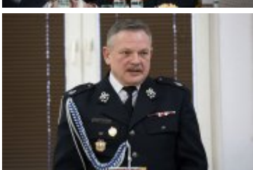
• 2017-02-15-Walne Zebranie Sprawozdawcze OSP Rabka