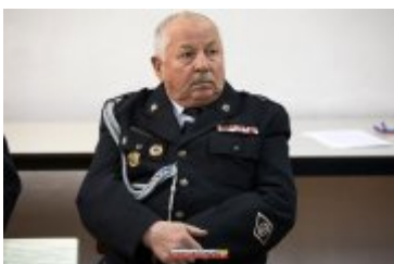
• 2017-02-15-Walne Zebranie Sprawozdawcze OSP Rabka