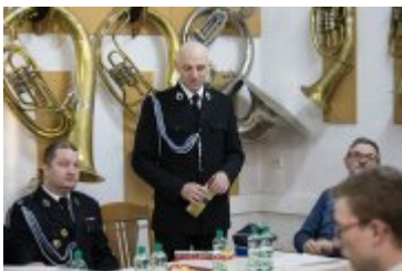
• 2017-02-15-Walne Zebranie Sprawozdawcze OSP Rabka