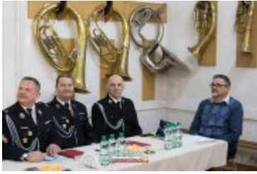
• 2017-02-15-Walne Zebranie Sprawozdawcze OSP Rabka