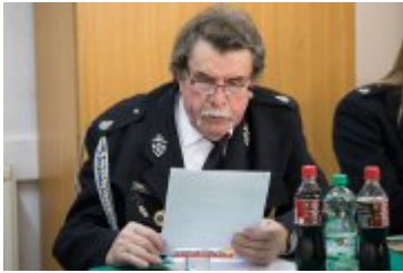
• 2017-02-15-Walne Zebranie Sprawozdawcze OSP Rabka