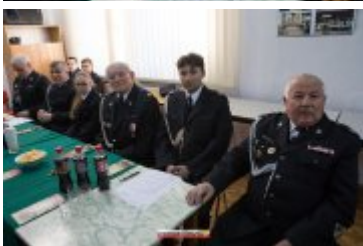
• 2017-02-15-Walne Zebranie Sprawozdawcze OSP Rabka