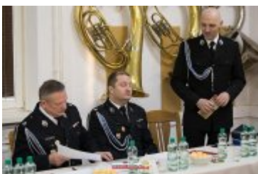
• 2017-02-15-Walne Zebranie Sprawozdawcze OSP Rabka