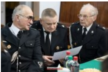
• 2017-02-15-Walne Zebranie Sprawozdawcze OSP Rabka