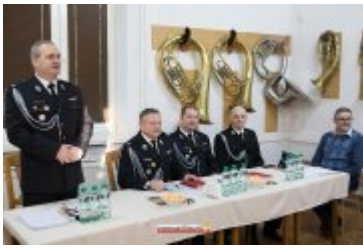
• 2017-02-15-Walne Zebranie Sprawozdawcze OSP Rabka