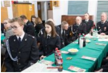
• 2017-02-15-Walne Zebranie Sprawozdawcze OSP Rabka