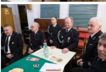
• 2017-02-15-Walne Zebranie Sprawozdawcze OSP Rabka