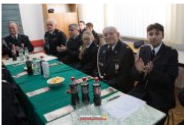
• 2017-02-15-Walne Zebranie Sprawozdawcze OSP Rabka