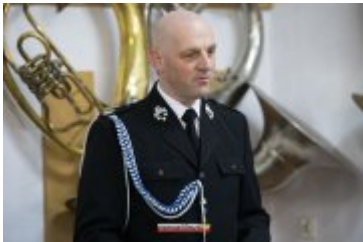
• 2017-02-15-Walne Zebranie Sprawozdawcze OSP Rabka