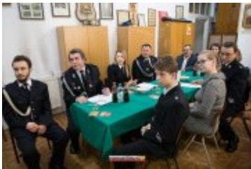
• 2017-02-15-Walne Zebranie Sprawozdawcze OSP Rabka