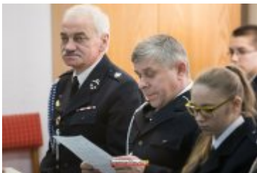
• 2017-02-15-Walne Zebranie Sprawozdawcze OSP Rabka