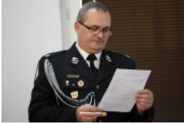
• 2017-02-15-Walne Zebranie Sprawozdawcze OSP Rabka