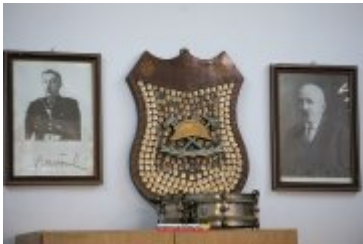
• 2017-02-15-Walne Zebranie Sprawozdawcze OSP Rabka