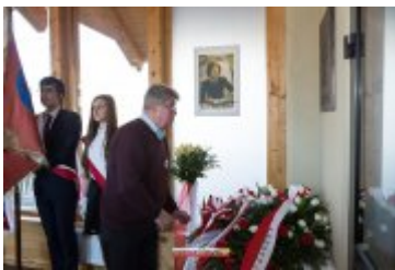
• 2017-02-16-Wizyta Prezydenta RP Andrzeja Dudy w Liceum im. E.