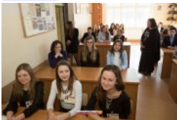
• 2017-02-16-Wizyta Prezydenta RP Andrzeja Dudy w Liceum im. E. Romera