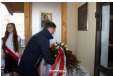
• 2017-02-16-Wizyta Prezydenta RP Andrzeja Dudy w Liceum im. E. Romera