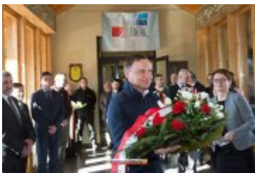
• 2017-02-16-Wizyta Prezydenta RP Andrzeja Dudy w Liceum im. E. Romera