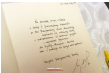
• 2017-02-16-Wizyta Prezydenta RP Andrzeja Dudy w Liceum im. E. Romera