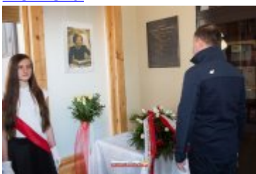
• 2017-02-16-Wizyta Prezydenta RP Andrzeja Dudy w Liceum im. E. Romera