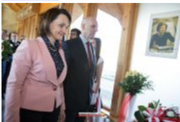
• 2017-02-16-Wizyta Prezydenta RP Andrzeja Dudy w Liceum im. E.