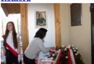
• 2017-02-16-Wizyta Prezydenta RP Andrzeja Dudy w Liceum im. E. Romera