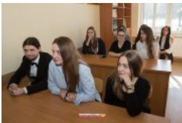
• 2017-02-16-Wizyta Prezydenta RP Andrzeja Dudy w Liceum im. E. Romera