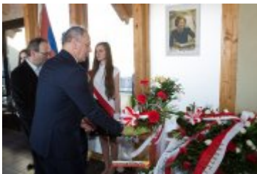
• 2017-02-16-Wizyta Prezydenta RP Andrzeja Dudy w Liceum im. E.