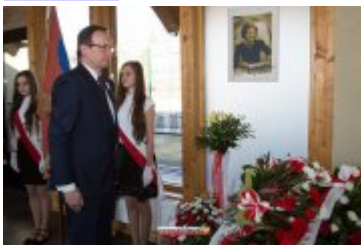
• 2017-02-16-Wizyta Prezydenta RP Andrzeja Dudy w Liceum im. E.