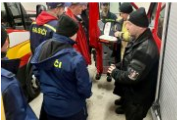
• 2025-01-30- Projekt INTERREG PL-SK 2021-2027