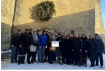
• 2025-01-30- Projekt INTERREG PL-SK 2021-2027