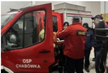
• 2025-01-30- Projekt INTERREG PL-SK 2021-2027