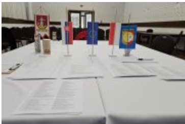
• 2025-01-30- Projekt INTERREG PL-SK 2021-2027