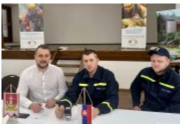
• 2025-01-30- Projekt INTERREG PL-SK 2021-2027