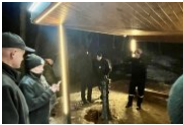
• 2025-01-30- Projekt INTERREG PL-SK 2021-2027