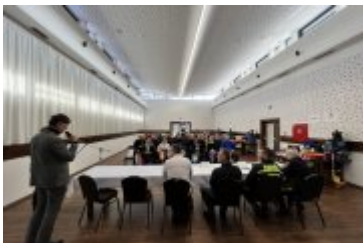
• 2025-01-30- Projekt INTERREG PL-SK 2021-2027