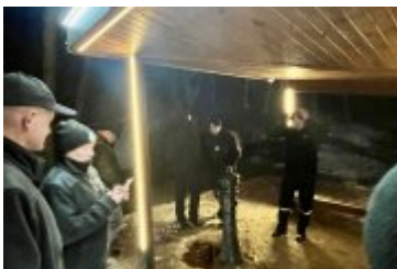
• 2025-01-30- Projekt INTERREG PL-SK 2021-2027