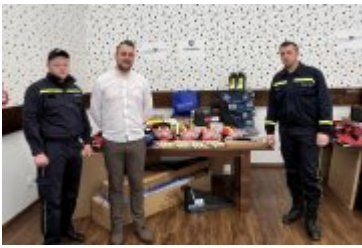
• 2025-01-30- Projekt INTERREG PL-SK 2021-2027