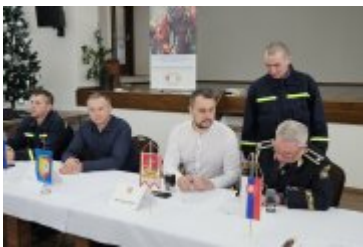
• 2025-01-30- Projekt INTERREG PL-SK 2021-2027