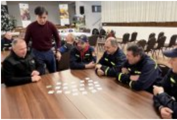
• 2025-01-30- Projekt INTERREG PL-SK 2021-2027