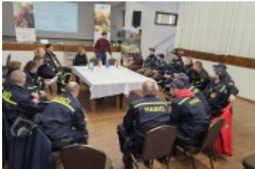
• 2025-01-30- Projekt INTERREG PL-SK 2021-2027