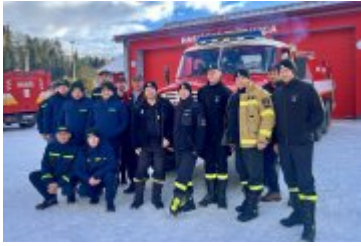
• 2025-01-30- Projekt INTERREG PL-SK 2021-2027