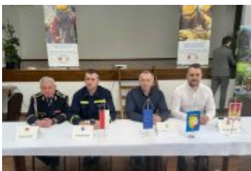
• 2025-01-30- Projekt INTERREG PL-SK 2021-2027