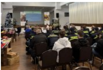
• 2025-01-30- Projekt INTERREG PL-SK 2021-2027