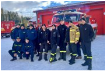
• 2025-01-30- Projekt INTERREG PL-SK 2021-2027