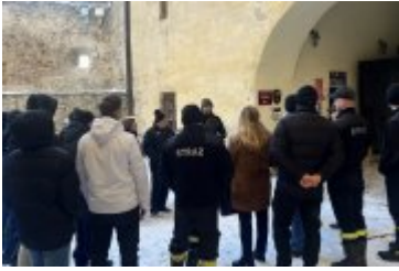
• 2025-01-30- Projekt INTERREG PL-SK 2021-2027