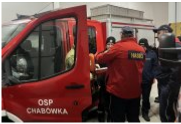
• 2025-01-30- Projekt INTERREG PL-SK 2021-2027