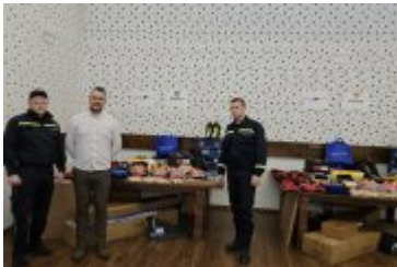
• 2025-01-30- Projekt INTERREG PL-SK 2021-2027