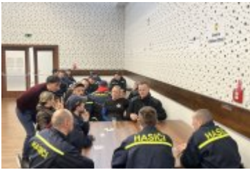
• 2025-01-30- Projekt INTERREG PL-SK 2021-2027