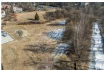
• 2025-02-22- Budowa pumtracka - wizualizacja i stan obecny