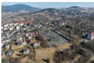
• 2025-02-22- Budowa pumtracka - wizualizacja i stan obecny