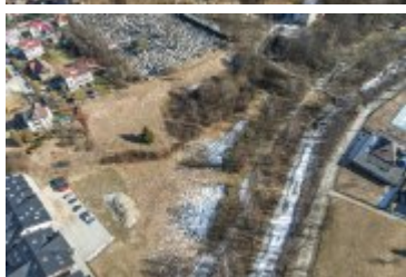
• 2025-02-22- Budowa pumtracka - wizualizacja i stan obecny