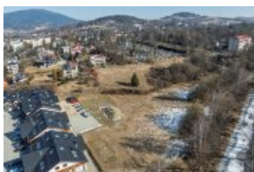
• 2025-02-22- Budowa pumtracka - wizualizacja i stan obecny