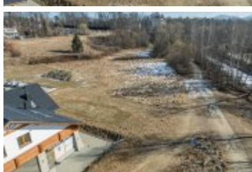
• 2025-02-22- Budowa pumtracka - wizualizacja i stan obecny