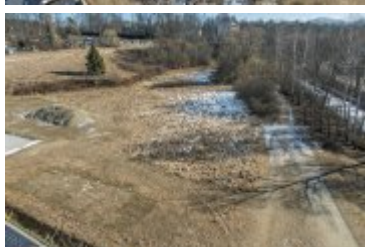
• 2025-02-22- Budowa pumtracka - wizualizacja i stan obecny