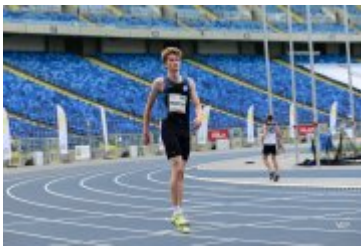
• 2023-07-07-Rabczańscy lekkoatleci wystąpili na Stadionie Śląskim