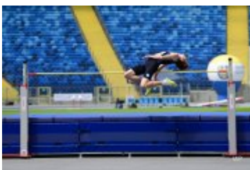
• 2023-07-07-Rabczańscy lekkoatleci wystąpili na Stadionie Śląskim