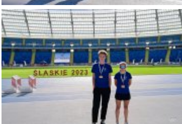
• 2023-07-07-Rabczańscy lekkoatleci wystąpili na Stadionie Śląskim