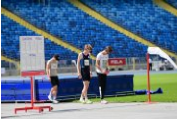
• 2023-07-07-Rabczańscy lekkoatleci wystąpili na Stadionie Śląskim