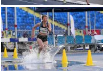
• 2023-07-07-Rabczańscy lekkoatleci wystąpili na Stadionie Śląskim