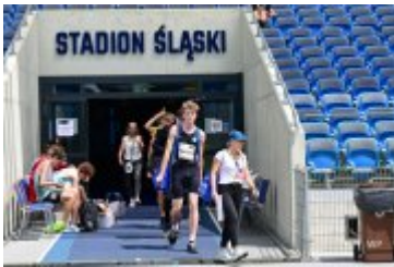
• 2023-07-07-Rabczańscy lekkoatleci wystąpili na Stadionie Śląskim