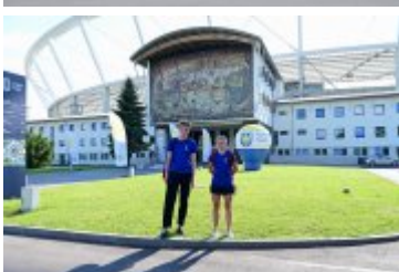
• 2023-07-07-Rabczańscy lekkoatleci wystąpili na Stadionie Śląskim