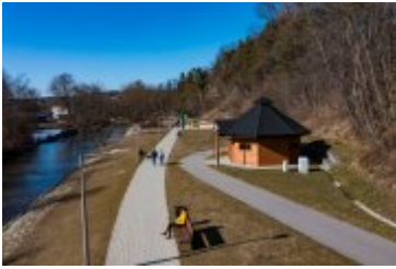
• 2022-03-14-Bulwary nad Poniczanką