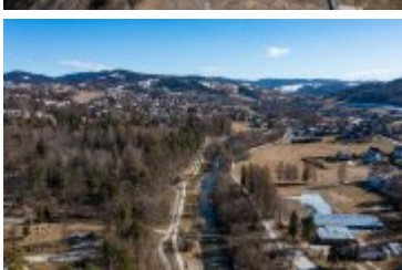
• 2022-03-14-Bulwary nad Poniczanką