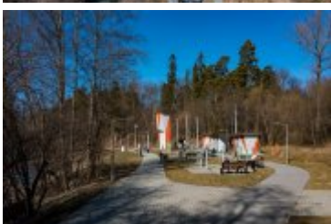
• 2022-03-14-Bulwary nad Poniczanką