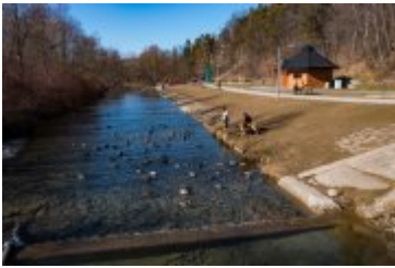
• 2022-03-14-Bulwary nad Poniczanką