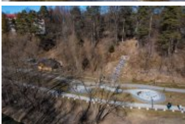
• 2022-03-14-Bulwary nad Poniczanką