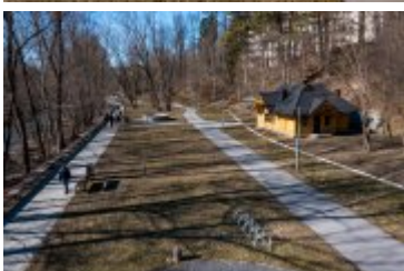
• 2022-03-14-Bulwary nad Poniczanką