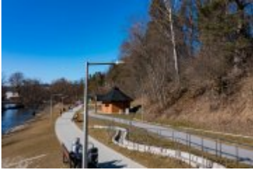
• 2022-03-14-Bulwary nad Poniczanką