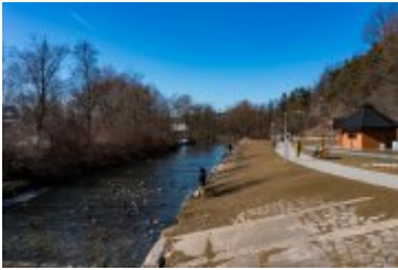
• 2022-03-14-Bulwary nad Poniczanką