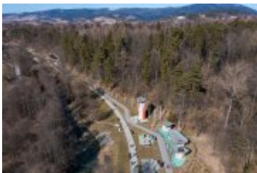
• 2022-03-14-Bulwary nad Poniczanką