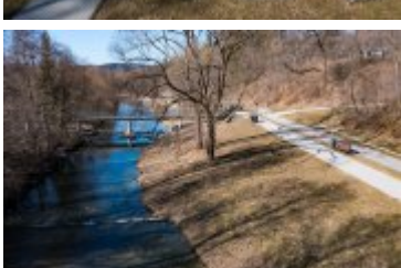
• 2022-03-14-Bulwary nad Poniczanką