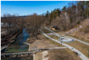
• 2022-03-14-Bulwary nad Poniczanką