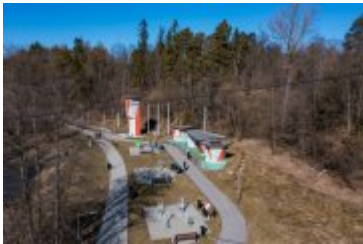
• 2022-03-14-Bulwary nad Poniczanką