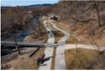
• 2022-03-14-Bulwary nad Poniczanką