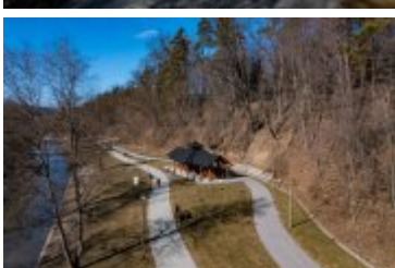
• 2022-03-14-Bulwary nad Poniczanką