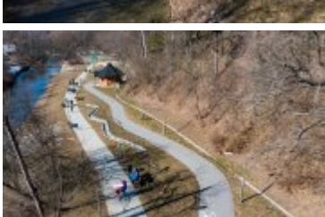
• 2022-03-14-Bulwary nad Poniczanką