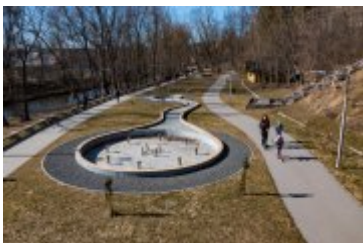
• 2022-03-14-Bulwary nad Poniczanką