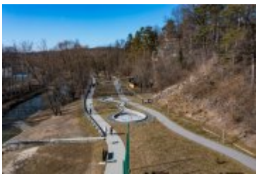
• 2022-03-14-Bulwary nad Poniczanką