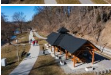
• 2022-03-14-Bulwary nad Poniczanką