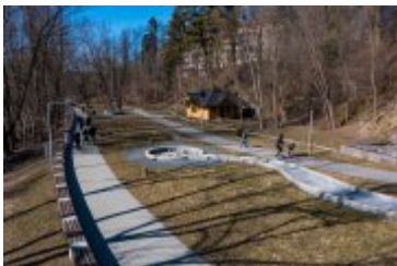
• 2022-03-14-Bulwary nad Poniczanką