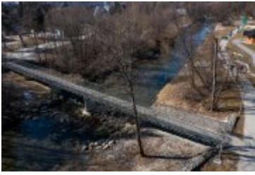
• 2022-03-14-Bulwary nad Poniczanką