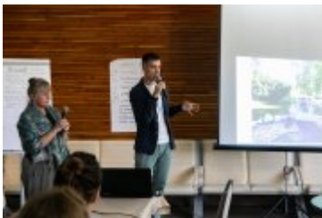
• 2019-09-10-Warsztaty polsko-słowackie "RÓŻNE OBLICZA WODY"