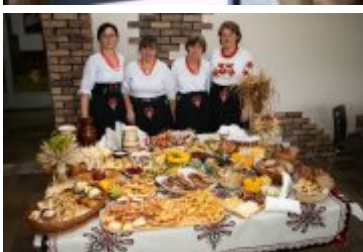
• 2019-09-10-Warsztaty polsko-słowackie "RÓŻNE OBLICZA WODY"