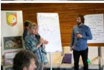
• 2019-09-10-Warsztaty polsko-słowackie "RÓŻNE OBLICZA WODY"