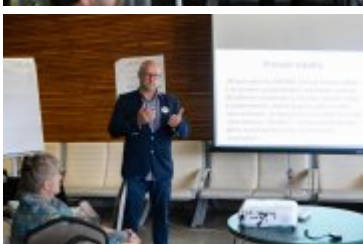
• 2019-09-10-Warsztaty polsko-słowackie "RÓŻNE OBLICZA WODY"