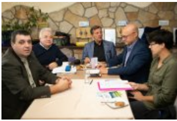
• 2019-09-10-Warsztaty polsko-słowackie "RÓŻNE OBLICZA WODY"