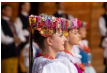
• 2020-08-14-Koncert zespołu Śląsk w Amfiteatrze