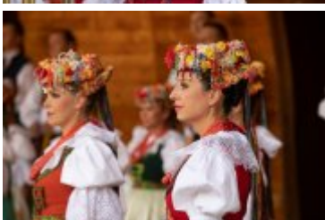
• 2020-08-14-Koncert zespołu Śląsk w Amfiteatrze