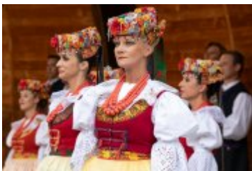
• 2020-08-14-Koncert zespołu Śląsk w Amfiteatrze