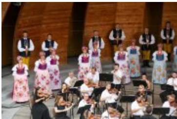
• 2020-08-14-Koncert zespołu Śląsk w Amfiteatrze