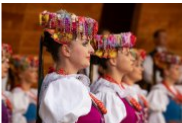
• 2020-08-14-Koncert zespołu Śląsk w Amfiteatrze