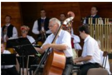
• 2020-08-14-Koncert zespołu Śląsk w Amfiteatrze