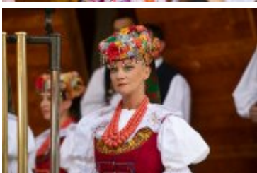
• 2020-08-14-Koncert zespołu Śląsk w Amfiteatrze