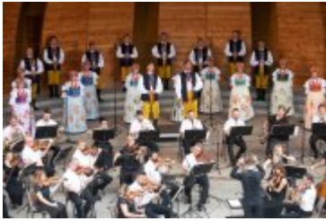
• 2020-08-14-Koncert zespołu Śląsk w Amfiteatrze