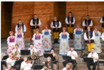
• 2020-08-14-Koncert zespołu Śląsk w Amfiteatrze