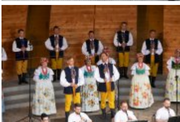
• 2020-08-14-Koncert zespołu Śląsk w Amfiteatrze