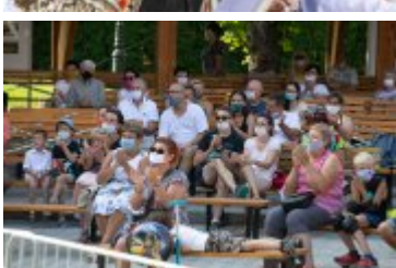
• 2020-08-14-Koncert zespołu Śląsk w Amfiteatrze