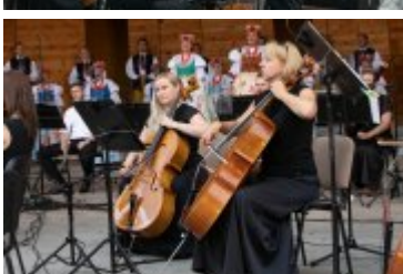
• 2020-08-14-Koncert zespołu Śląsk w Amfiteatrze