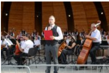
• 2020-08-14-Koncert zespołu Śląsk w Amfiteatrze