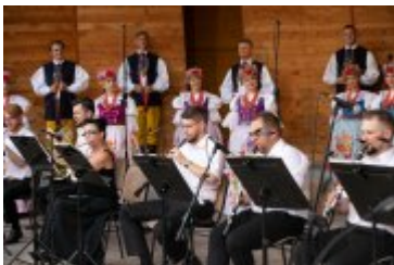
• 2020-08-14-Koncert zespołu Śląsk w Amfiteatrze