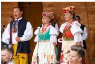
• 2020-08-14-Koncert zespołu Śląsk w Amfiteatrze