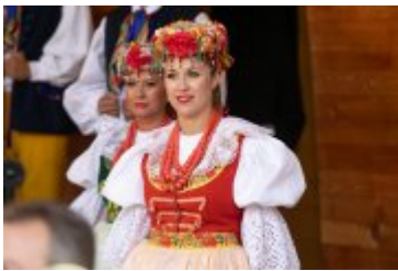
• 2020-08-14-Koncert zespołu Śląsk w Amfiteatrze