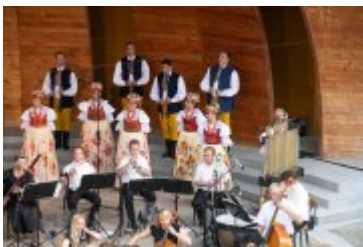
• 2020-08-14-Koncert zespołu Śląsk w Amfiteatrze