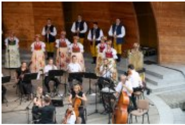
• 2020-08-14-Koncert zespołu Śląsk w Amfiteatrze