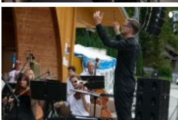
• 2020-08-14-Koncert zespołu Śląsk w Amfiteatrze