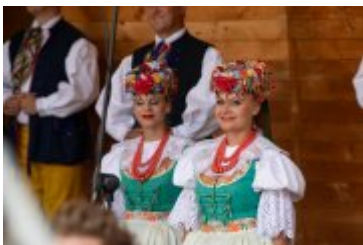
• 2020-08-14-Koncert zespołu Śląsk w Amfiteatrze