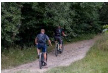
• 2024-0813-Spojrzenie na Rabkę z polany Krzysie