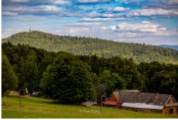
• 2024-0813-Spojrzenie na Rabkę z polany Krzysie