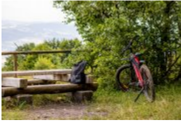
• 2024-0813-Spojrzenie na Rabkę z polany Krzysie