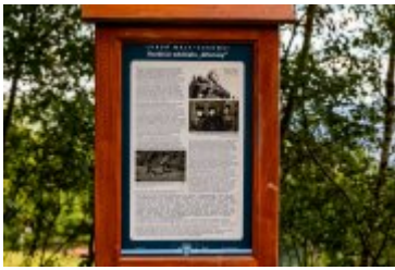
• 2024-0813-Spojrzenie na Rabkę z polany Krzysie