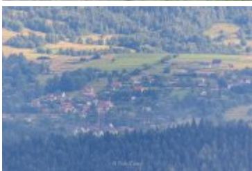
• 2024-0813-Spojrzenie na Rabkę z polany Krzysie