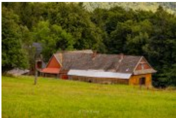
• 2024-0813-Spojrzenie na Rabkę z polany Krzysie