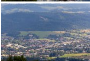
• 2024-0813-Spojrzenie na Rabkę z polany Krzysie