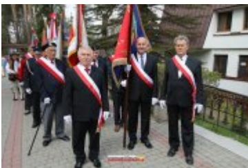
2017-05-03-Obchody Święta Konstytucji 3 Maja w Rabce-Zdroju