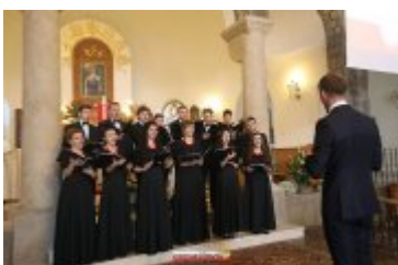
• 2017-05-03-Obchody Świeta Konstytucji 3 Maja w Rabce-Zdroju