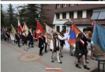
2017-05-03-Obchody Święta Konstytucji 3 Maja w Rabce-Zdroju