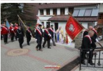
2017-05-03-Obchody Święta Konstytucji 3 Maja w Rabce-Zdroju