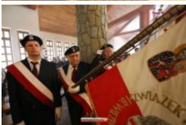
• 2017-05-03-Obchody Świeta Konstytucji 3 Maja w Rabce-Zdroju