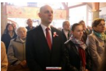
• 2017-05-03-Obchody Świeta Konstytucji 3 Maja w Rabce-Zdroju