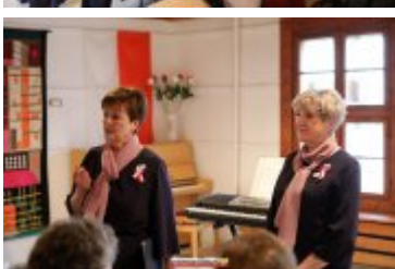
• 2017-05-03-Obchody Świeta Konstytucji 3 Maja w Rabce-Zdroju