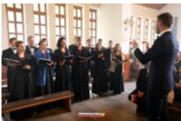
• 2017-05-03-Obchody Świeta Konstytucji 3 Maja w Rabce-Zdroju