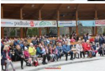
• 2017-05-03-Obchody Świeta Konstytucji 3 Maja w Rabce-Zdroju