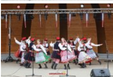
• 2017-05-03-Obchody Świeta Konstytucji 3 Maja w Rabce-Zdroju