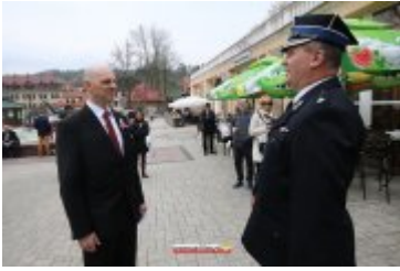
• 2017-05-03-Obchody Świeta Konstytucji 3 Maja w Rabce-Zdroju