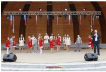
• 2017-05-03-Obchody Świeta Konstytucji 3 Maja w Rabce-Zdroju