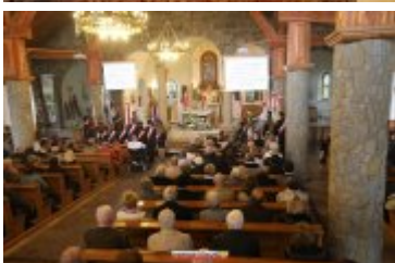
• 2017-05-03-Obchody Świeta Konstytucji 3 Maja w Rabce-Zdroju