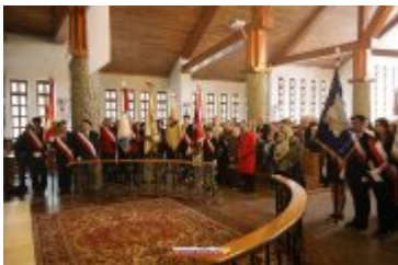
• 2017-05-03-Obchody Świeta Konstytucji 3 Maja w Rabce-Zdroju