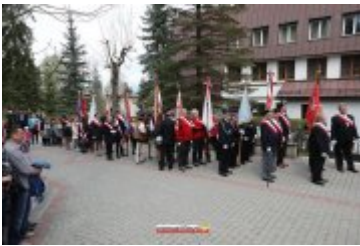
2017-05-03-Obchody Święta Konstytucji 3 Maja w Rabce-Zdroju