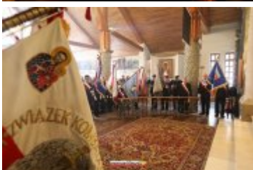
• 2017-05-03-Obchody Świeta Konstytucji 3 Maja w Rabce-Zdroju