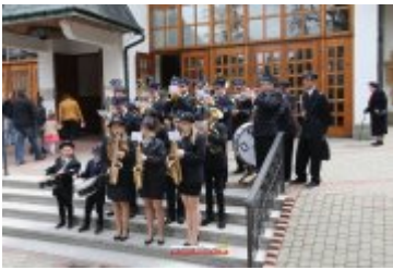
2017-05-03-Obchody Święta Konstytucji 3 Maja w Rabce-Zdroju