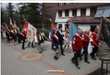
2017-05-03-Obchody Święta Konstytucji 3 Maja w Rabce-Zdroju