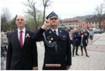
• 2017-05-03-Obchody Świeta Konstytucji 3 Maja w Rabce-Zdroju