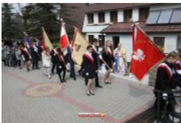
• 2017-05-03-Obchody Świeta Konstytucji 3 Maja w Rabce-Zdroju