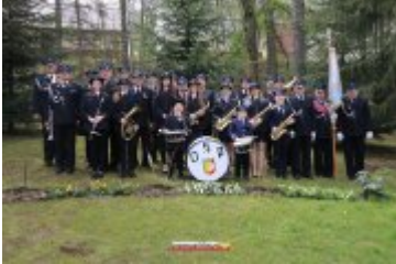
2017-05-03-Obchody Święta Konstytucji 3 Maja w Rabce-Zdroju