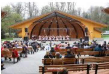
• 2017-05-03-Obchody Świeta Konstytucji 3 Maja w Rabce-Zdroju