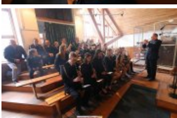
• 2017-05-03-Obchody Świeta Konstytucji 3 Maja w Rabce-Zdroju