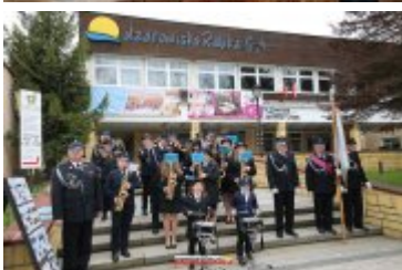
• 2017-05-03-Obchody Świeta Konstytucji 3 Maja w Rabce-Zdroju