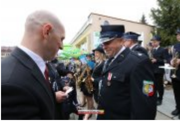
• 2017-05-03-Obchody Świeta Konstytucji 3 Maja w Rabce-Zdroju