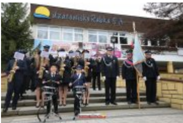
• 2017-05-03-Obchody Świeta Konstytucji 3 Maja w Rabce-Zdroju