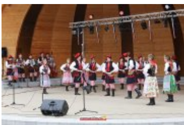
• 2017-05-03-Obchody Świeta Konstytucji 3 Maja w Rabce-Zdroju