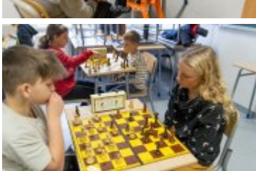
• 2025-02-01- Szachowe Mistrzostwa Podhala rozpoczęte