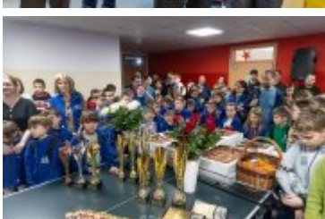
• 2025-02-01- Szachowe Mistrzostwa Podhala rozpoczęte