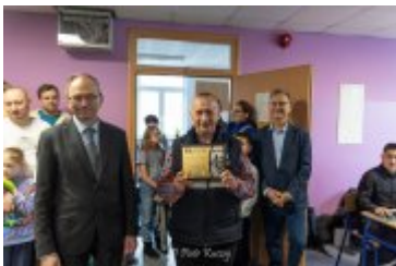
• 2025-02-01- Szachowe Mistrzostwa Podhala rozpoczęte