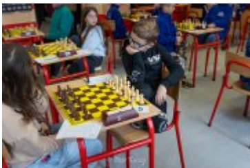
• 2025-02-01- Szachowe Mistrzostwa Podhala rozpoczęte