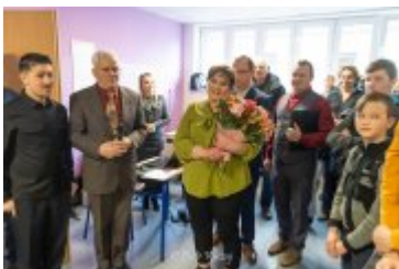
• 2025-02-01- Szachowe Mistrzostwa Podhala rozpoczęte