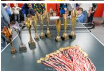
• 2025-02-01- Szachowe Mistrzostwa Podhala rozpoczęte