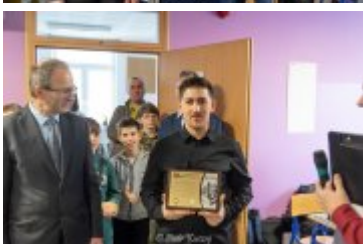
• 2025-02-01- Szachowe Mistrzostwa Podhala rozpoczęte