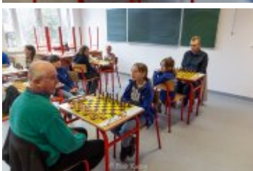
• 2025-02-01- Szachowe Mistrzostwa Podhala rozpoczęte