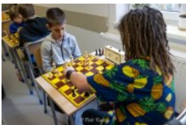
• 2025-02-01- Szachowe Mistrzostwa Podhala rozpoczęte