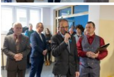
• 2025-02-01- Szachowe Mistrzostwa Podhala rozpoczęte