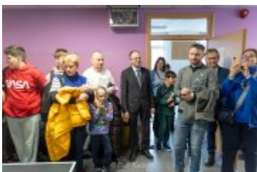
• 2025-02-01- Szachowe Mistrzostwa Podhala rozpoczęte