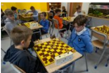
• 2025-02-01- Szachowe Mistrzostwa Podhala rozpoczęte