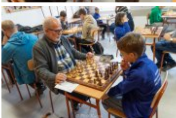
• 2025-02-01- Szachowe Mistrzostwa Podhala rozpoczęte