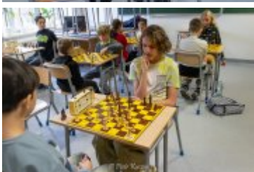
• 2025-02-01- Szachowe Mistrzostwa Podhala rozpoczęte