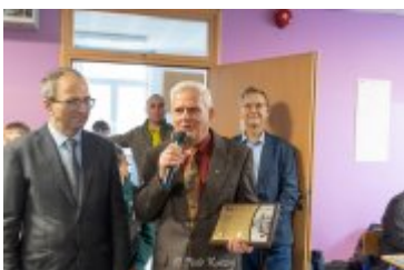
• 2025-02-01- Szachowe Mistrzostwa Podhala rozpoczęte