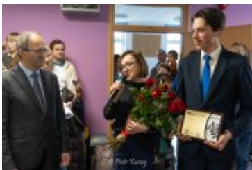
• 2025-02-01- Szachowe Mistrzostwa Podhala rozpoczęte