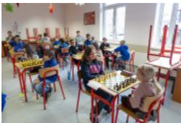
• 2025-02-01- Szachowe Mistrzostwa Podhala rozpoczęte