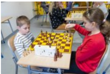
• 2025-02-01- Szachowe Mistrzostwa Podhala rozpoczęte