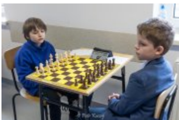
• 2025-02-01- Szachowe Mistrzostwa Podhala rozpoczęte