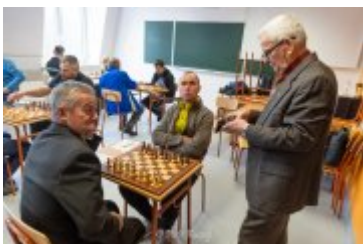
• 2025-02-01- Szachowe Mistrzostwa Podhala rozpoczęte