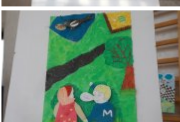
• 2018-03-21-Obchody Światowego Dnia Osób z Zespołem Downa