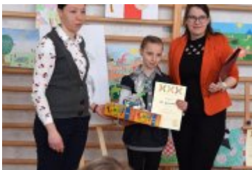
• 2018-03-21-Obchody Światowego Dnia Osób z Zespołem Downa