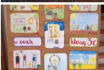
• 2018-03-21-Obchody Światowego Dnia Osób z Zespołem Downa