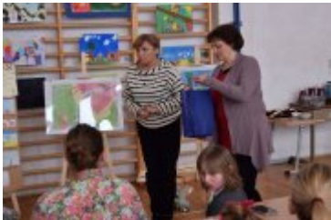
• 2018-03-21-Obchody Światowego Dnia Osób z Zespołem Downa