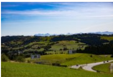
• 2019-09-15-Wycieczka piesza z Rabki na Piątkową Górę i Krzywoń