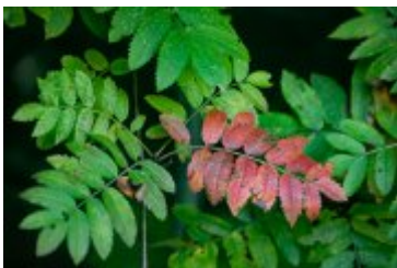
• 2019-09-15-Wycieczka piesza z Rabki na Piątkową Górę i Krzywoń