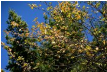
• 2019-09-15-Wycieczka piesza z Rabki na Piątkową Górę i Krzywoń