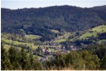
• 2019-09-15-Wycieczka piesza z Rabki na Piątkową Górę i Krzywoń