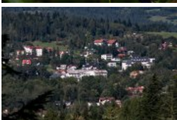
• 2019-09-15-Wycieczka piesza z Rabki na Piątkową Górę i Krzywoń