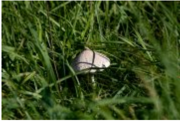
• 2019-09-15-Wycieczka piesza z Rabki na Piątkową Górę i Krzywoń