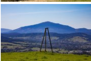
• 2019-09-15-Wycieczka piesza z Rabki na Piątkową Górę i Krzywoń