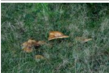
• 2019-09-15-Wycieczka piesza z Rabki na Piątkową Górę i Krzywoń