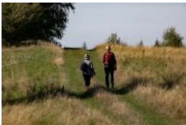
• 2019-09-15-Wycieczka piesza z Rabki na Piątkową Górę i Krzywoń