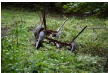
• 2019-09-15-Wycieczka piesza z Rabki na Piątkową Górę i Krzywoń