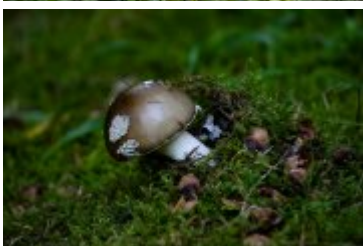
• 2019-09-15-Wycieczka piesza z Rabki na Piątkową Górę i Krzywoń