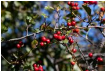
• 2019-09-15-Wycieczka piesza z Rabki na Piątkową Górę i Krzywoń