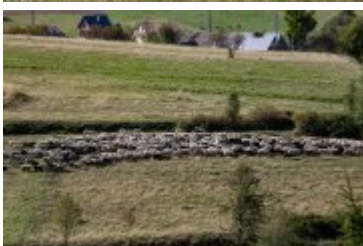
• 2019-09-15-Wycieczka piesza z Rabki na Piątkową Górę i Krzywoń