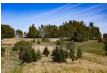
• 2019-09-15-Wycieczka piesza z Rabki na Piątkową Górę i Krzywoń