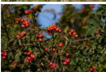
• 2019-09-15-Wycieczka piesza z Rabki na Piątkową Górę i Krzywoń