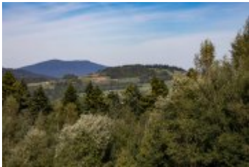
• 2019-09-15-Wycieczka piesza z Rabki na Piątkową Górę i Krzywoń