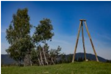
• 2019-09-15-Wycieczka piesza z Rabki na Piątkową Górę i Krzywoń