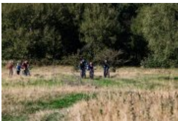
• 2019-09-15-Wycieczka piesza z Rabki na Piątkową Górę i Krzywoń