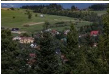
• 2019-09-15-Wycieczka piesza z Rabki na Piątkową Górę i Krzywoń