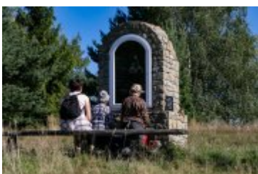
• 2019-09-15-Wycieczka piesza z Rabki na Piątkową Górę i Krzywoń