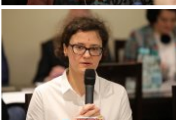
• 2017-03-16-Posiedzenie Sejmowej Komisji Ochrony Środowiska