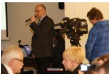
• 2017-03-16-Posiedzenie Sejmowej Komisji Ochrony Środowiska