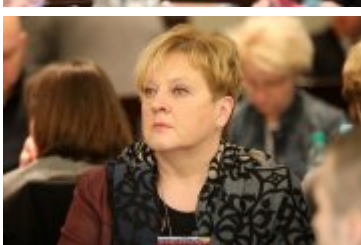
• 2017-03-16-Posiedzenie Sejmowej Komisji Ochrony Środowiska