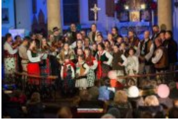
• 2017-02-02-VII Rabczańskie Kołędowanie