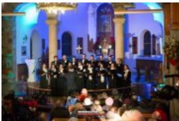
• 2017-02-02-VII Rabczańskie Kołędowanie