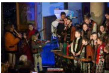
• 2017-02-02-VII Rabczańskie Koledowanie