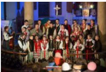
• 2017-02-02-VII Rabczańskie Kołędowanie