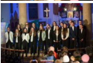
• 2017-02-02-VII Rabczańskie Kołędowanie