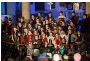
• 2017-02-02-VII Rabczańskie Koledowanie