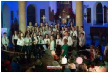
• 2017-02-02-VII Rabczańskie Koledowanie