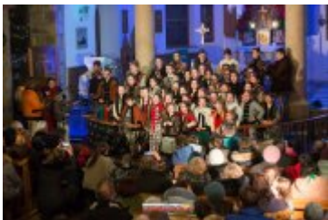
• 2017-02-02-VII Rabczańskie Koledowanie