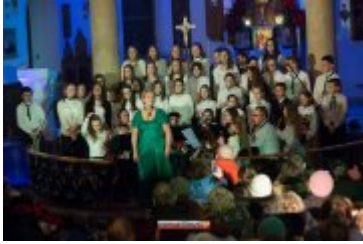
• 2017-02-02-VII Rabczańskie Koledowanie