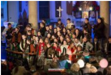
• 2017-02-02-VII Rabczańskie Koledowanie