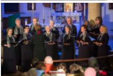
• 2017-02-02-VII Rabczańskie Kołędowanie