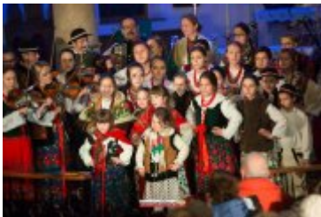
• 2017-02-02-VII Rabczańskie Kołędowanie