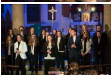
• 2017-02-02-VII Rabczańskie Kołędowanie