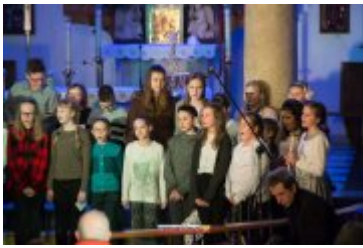
• 2017-02-02-VII Rabczańskie Koledowanie