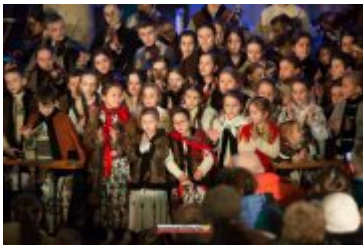
• 2017-02-02-VII Rabczańskie Kołędowanie