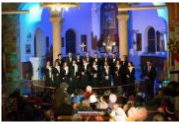
• 2017-02-02-VII Rabczańskie Kołędowanie