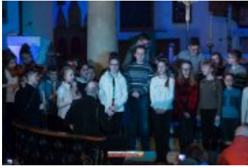
• 2017-02-02-VII Rabczańskie Koledowanie