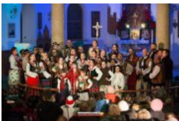
• 2017-02-02-VII Rabczańskie Kołędowanie