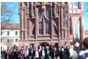
• 2018-06-11-Harcerze z wizytą na Litwie