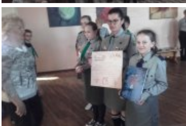
• 2018-06-11-Harcerze z wizytą na Litwie