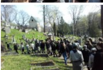
• 2018-06-11-Harcerze z wizytą na Litwie