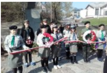
• 2018-06-11-Harcerze z wizytą na Litwie