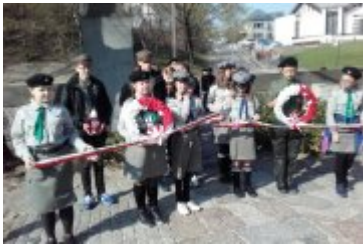
• 2018-06-11-Harcerze z wizytą na Litwie