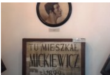
• 2018-06-11-Harcerze z wizytą na Litwie