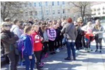
• 2018-06-11-Harcerze z wizytą na Litwie