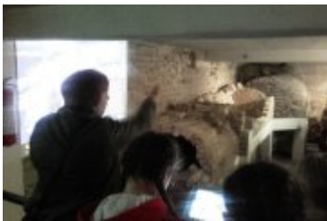
• 2018-06-11-Harcerze z wizytą na Litwie