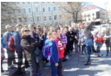
• 2018-06-11-Harcerze z wizytą na Litwie