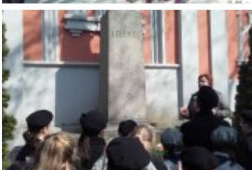
• 2018-06-11-Harcerze z wizytą na Litwie