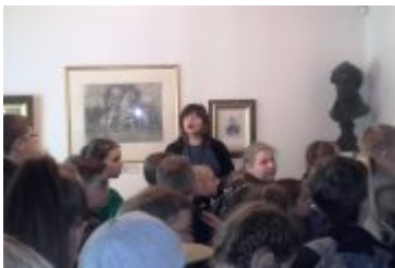
• 2018-06-11-Harcerze z wizytą na Litwie