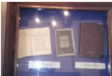
• 2018-06-11-Harcerze z wizytą na Litwie