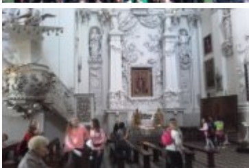
• 2018-06-11-Harcerze z wizytą na Litwie