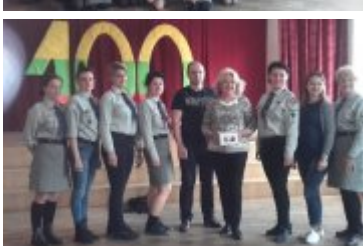
• 2018-06-11-Harcerze z wizytą na Litwie