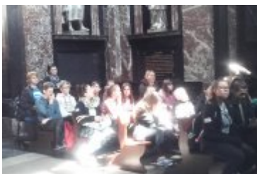
• 2018-06-11-Harcerze z wizytą na Litwie