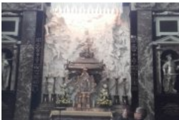
• 2018-06-11-Harcerze z wizytą na Litwie