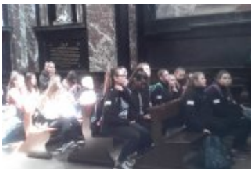
• 2018-06-11-Harcerze z wizytą na Litwie