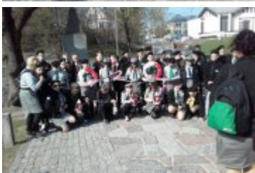
• 2018-06-11-Harcerze z wizytą na Litwie