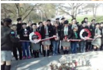
• 2018-06-11-Harcerze z wizytą na Litwie