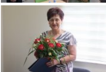
• 2020-06-30-XXIII Sesja Rady Miejskiej