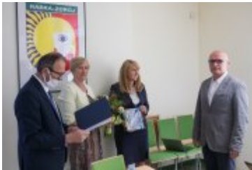
• 2020-06-30-XXIII Sesja Rady Miejskiej