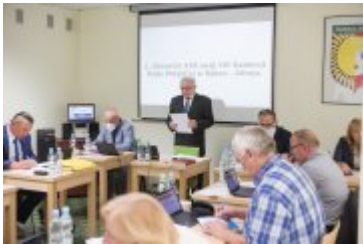
• 2020-06-30-XXIII Sesja Rady Miejskiej