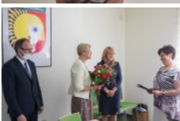
• 2020-06-30-XXIII Sesja Rady Miejskiej