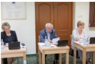
• 2020-06-30-XXIII Sesja Rady Miejskiej