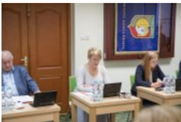
• 2020-06-30-XXIII Sesja Rady Miejskiej