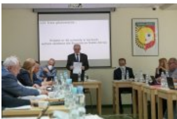
• 2020-06-30-XXIII Sesja Rady Miejskiej