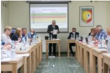
• 2020-06-30-XXIII Sesja Rady Miejskiej