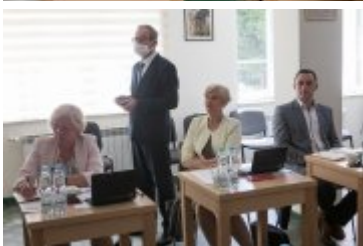
• 2020-06-30-XXIII Sesja Rady Miejskiej