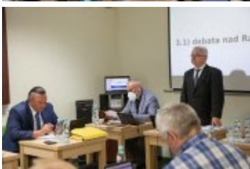
• 2020-06-30-XXIII Sesja Rady Miejskiej