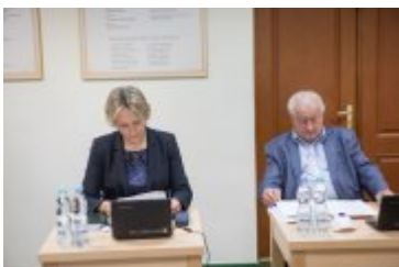
• 2020-06-30-XXIII Sesja Rady Miejskiej