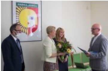
• 2020-06-30-XXIII Sesja Rady Miejskiej