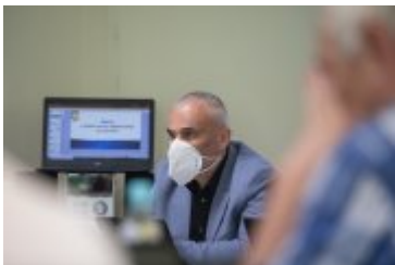
• 2020-06-30-XXIII Sesja Rady Miejskiej