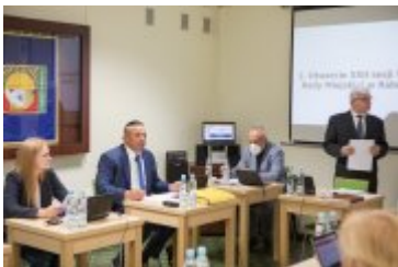
• 2020-06-30-XXIII Sesja Rady Miejskiej