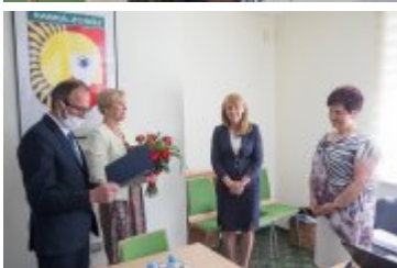
• 2020-06-30-XXIII Sesja Rady Miejskiej