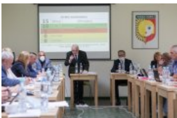
• 2020-06-30-XXIII Sesja Rady Miejskiej