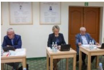
• 2020-06-30-XXIII Sesja Rady Miejskiej