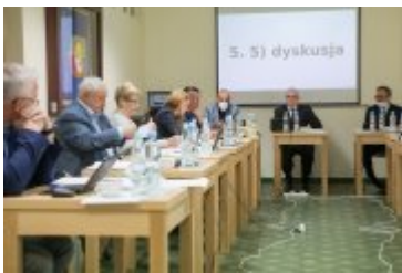
• 2020-06-30-XXIII Sesja Rady Miejskiej