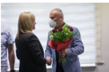
• 2020-06-30-XXIII Sesja Rady Miejskiej