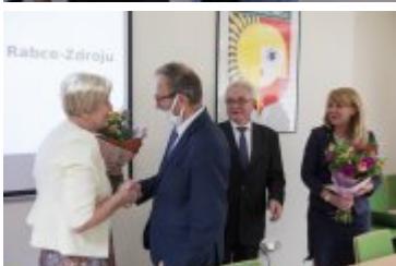
• 2020-06-30-XXIII Sesja Rady Miejskiej