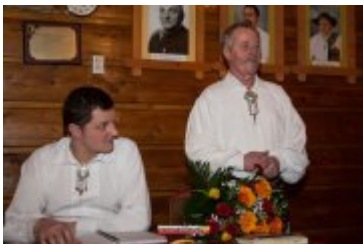
• 2017-02-05-Wybory w Gorczańskim Oddziale Związku Podhalan