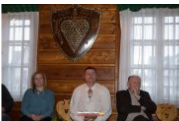
• 2017-02-05-Wybory w Gorczańskim Oddziale Związku Podhalan