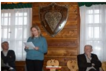
• 2017-02-05-Wybory w Gorczańskim Oddziale Związku Podhalan