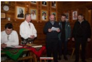
• 2017-02-05-Wybory w Gorczańskim Oddziale Związku Podhalan