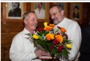
• 2017-02-05-Wybory w Gorczańskim Oddziale Związku Podhalan