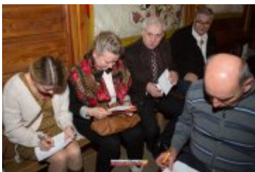
• 2017-02-05-Wybory w Gorczańskim Oddziale Związku Podhalan