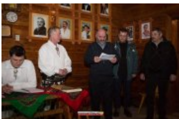
• 2017-02-05-Wybory w Gorczańskim Oddziale Związku Podhalan