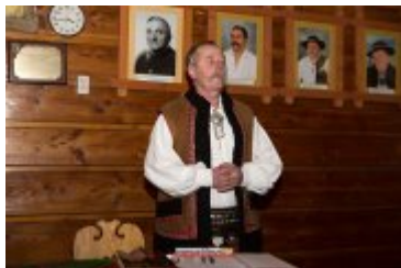
• 2017-02-05-Wybory w Gorczańskim Oddziale Związku Podhalan