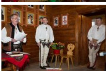
• 2017-02-05-Wybory w Gorczańskim Oddziale Związku Podhalan