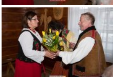
• 2017-02-05-Wybory w Gorczańskim Oddziale Związku Podhalan