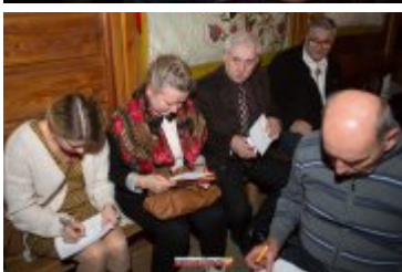
• 2017-02-05-Wybory w Gorczańskim Oddziale Związku Podhalan