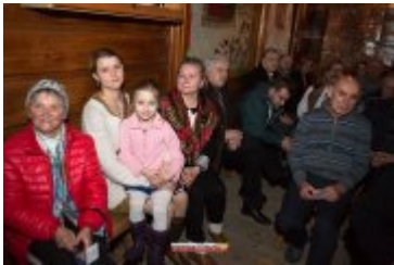
• 2017-02-05-Wybory w Gorczańskim Oddziale Związku Podhalan