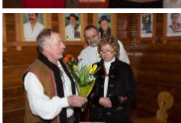
• 2017-02-05-Wybory w Gorczańskim Oddziale Związku Podhalan