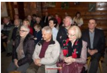
• 2017-02-05-Wybory w Gorczańskim Oddziale Związku Podhalan