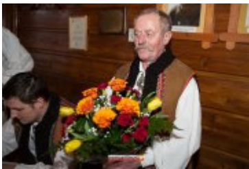
• 2017-02-05-Wybory w Gorczańskim Oddziale Związku Podhalan