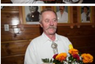
• 2017-02-05-Wybory w Gorczańskim Oddziale Związku Podhalan