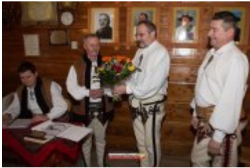
• 2017-02-05-Wybory w Gorczańskim Oddziale Związku Podhalan