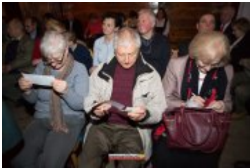
• 2017-02-05-Wybory w Gorczańskim Oddziale Związku Podhalan