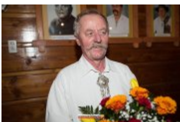
• 2017-02-05-Wybory w Gorczańskim Oddziale Związku Podhalan