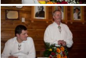
• 2017-02-05-Wybory w Gorczańskim Oddziale Związku Podhalan