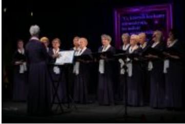
• 2019-11-09-XI Zaduszki Rabczańskie