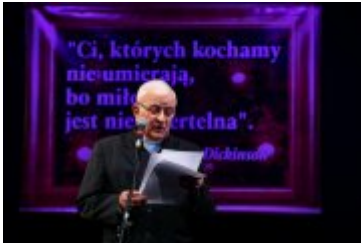
• 2019-11-09-XI Zaduszki Rabczańskie