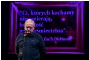
• 2019-11-09-XI Zaduszki Rabczańskie