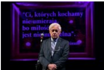
• 2019-11-09-XI Zaduszki Rabczańskie