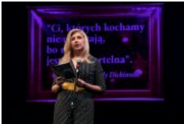
• 2019-11-09-XI Zaduszki Rabczańskie