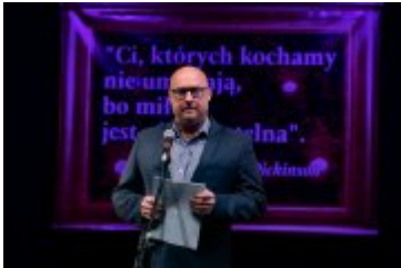
• 2019-11-09-XI Zaduszki Rabczańskie