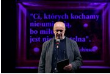
• 2019-11-09-XI Zaduszki Rabczańskie